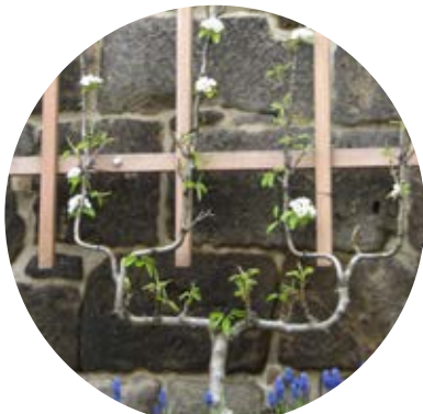
seltene Obstbäume: Spalierbirne

Das Gelände um den Sonnenstein hält aber auch noch andere Überraschungen bereit. Wenn ihr ganz aufmerksam seid, findet ihr auch Schätze der Natur - seltene Tiere und Pflanzen. Frag deine Eltern oder Lehrer, was die Dinge bedeuten.