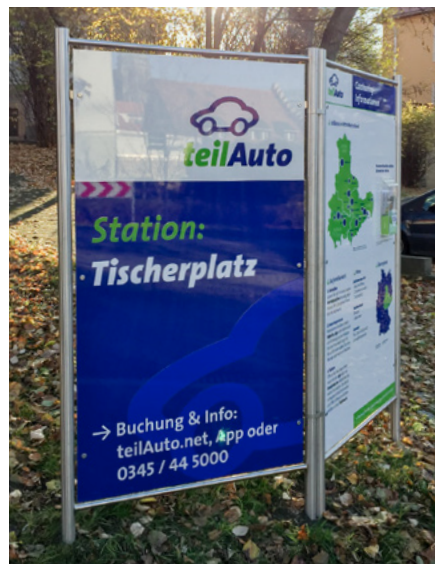
teilAuto-Station am Tischerplatz

teilAuto wurde 1992 in Halle an der Saale als ökologisch orientierter Verein gegründet und ist heute als Carsharing-Anbieter in insgesamt 19 Städten in Sachsen, Sachsen-Anhalt und Thüringen vertreten. Das Unternehmen stellt seinen rund 35.000 Nutzern über 1.000 Gemeinschaftsfahrzeuge vom Kleinstwagen bis zum Transporter bereit. teilAuto setzt dabei auf einen emissionsparenden Fuhrpark sowie die Stärkung eines nachhaltigen Mobilitätsmixes in Verbindung mit Bus, Bahn und Fahrrad. Für seine Dienstleistung trägt das Unternehmen das Umweltzeichen Blauer Engel. www.teilauto.net (JNi)