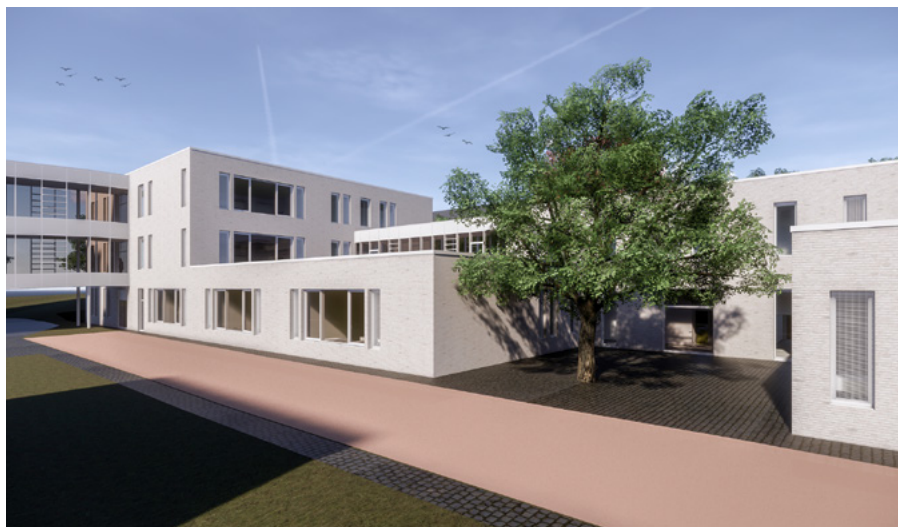
Visualisierung des Anbaus am Schiller-Gymnasium (Foto: Heinle, Wischer und Partner Freie Architekten)

Die Gesamtkosten für den Neubau einschließlich der Planungsleistungen, der Herrichtung der Außenanlagen sowie der Ausstattung der neuen Räumlichkeiten betragen ca. 6.715.000 Mio. Euro. Die Baumaßnahme wird durch den Freistaat Sachsen zu 40 % der förderfähigen Kosten aus dem Förderprogramm Schulinfra