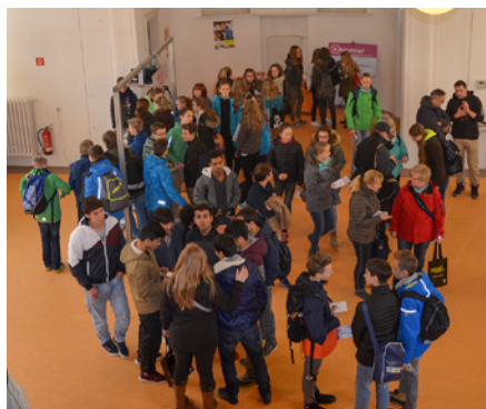
Zentrales Element der JugendFilmTage sind die Mitmach-Aktionen, die in der Hospital-Kirche aufgebaut wurden. Mitarbeitende u. a. des Hanno e. V. gingen mit den Jugendlichen ins Gespräch.

kampagnen „rauchfrei!“, „Null Alkohol – Voll Power“ und „Alkohol? Kenn dein Limit.“ der BZgA. Rund 400 Jugendliche im Alter von 12 bis 19 Jahren nahmen gemeinsam mit ihren Lehrkräften an der Aktion im Filmpalast Pirna teil.