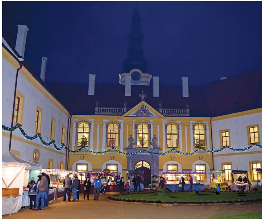
Innenhof des Dčíner Schlosses

Varkausring 1 b, Telefon: 710213 E-Mail: stadtteilbuero.sonnenstein@pirna.de Di. 09:00 – 12:00 u. 14:00 – 16:00 Uhr Do. 09:00 – 12:00 u. 14:00 – 18:00 Uhr