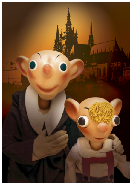
Spejbl & Hurvinek