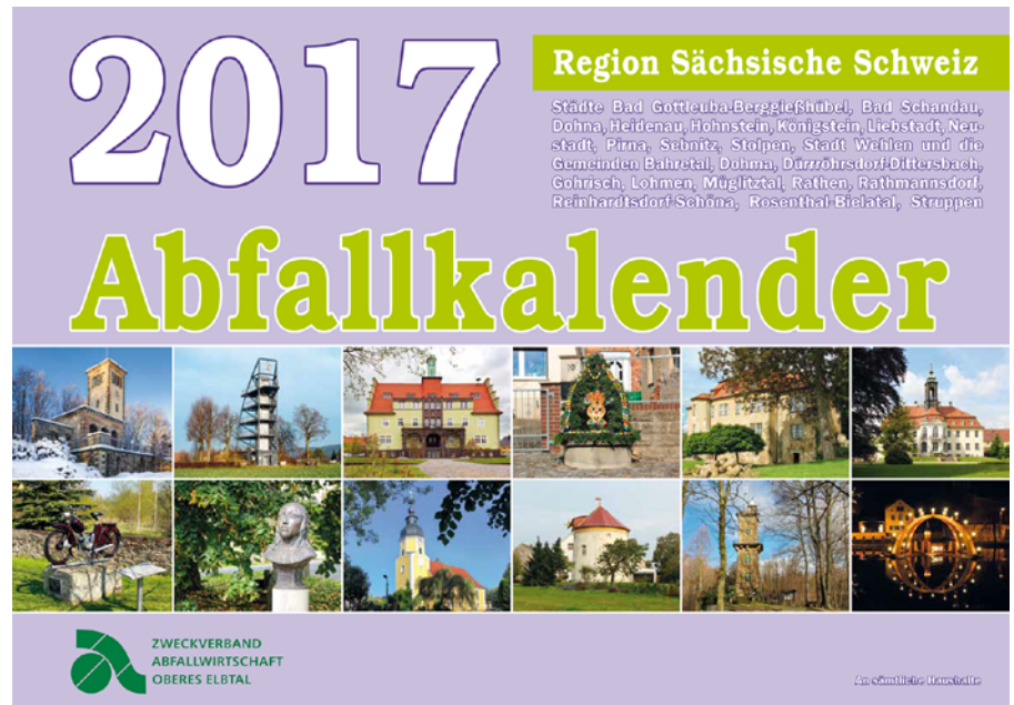
Titel Abfallkalender

Auch eine Meldung per E-Mail mit vollständiger Angabe des Namens und der Anschrift ist möglich info@zaoe.de . Die Termine des Zweckverbandes für 2017 sind im Internet unter www.zaoe.de als PDF-Datei und straßengenau im elektronischen Abfallkalender abrufbar. Sie können ausgedruckt oder in den persönlichen