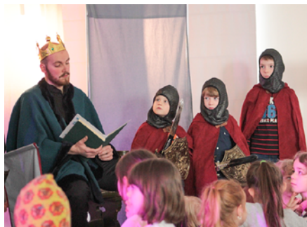
Kleine Komparsen in der Geschichte „Lohengrin“