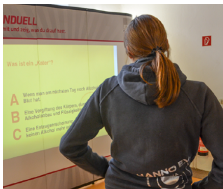
Beim Fragenduell – Denk mit und zeig, was du drauf hast stellen Jugendlichen ihr Wissen über Alkohol und Nikotin unter Beweis.