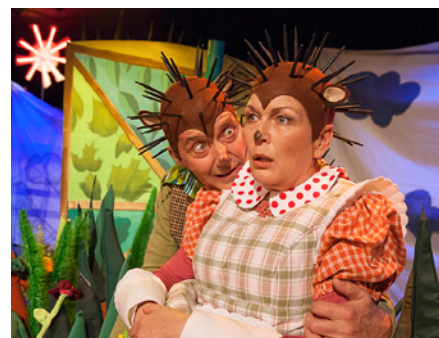
Theaterstück Hase und Igel der Landesbühnen Sachsen