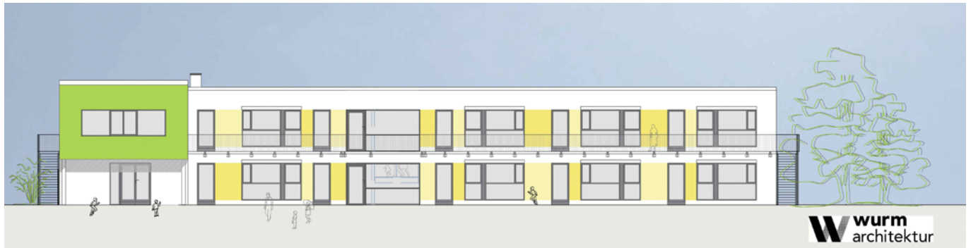
Ansicht der neuen Kindertageseinrichtung in Pirnas Stadtteil Copitz (Abbildung: wurm architektur)