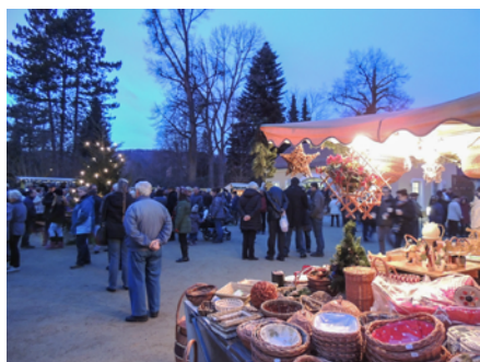
SchlossWeihnacht in Graupa