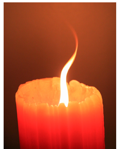
Einladung zur Kerzenaktion in Pirna