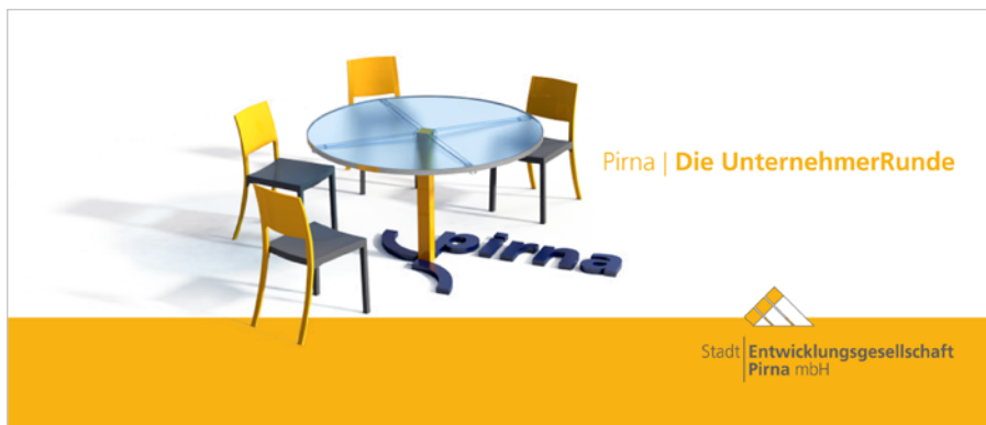
Logo Unternehmerrunde (Abbildung: SEP)