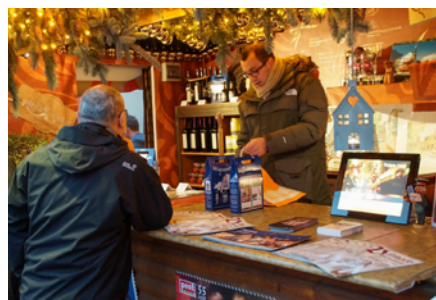
Weihnachtshütten der Pirnaer Gesellschaften und des Citymanagements

Ab dem 25. November präsentieren sich die Pirnaer Gesellschaften wieder gemeinsam mit dem Citymanagement Pirna e.V. auf dem Canalettomarkt in den festlich geschmückten Pirna-Hütten und bereichern das Angebot des Weihnachtsmarktes mit Pirnaer Unikaten, besonderen Geschenkideen, dem Weihnachtspostamt und der einzigartigen Feuerzangenbowle. Auch Tickets für Veranstaltungen in der Herderhalle, im Stadtmuseum Pirna, in der Stadtbibliothek Pirna und in den Richard-Wagner-Stätten Graupa sind wieder in den Hütten erhältlich.