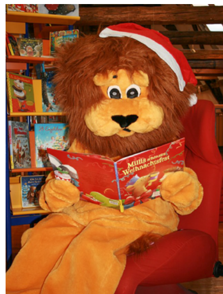
Der Leselöwe Bibolin aus der Stadtbibliothek

Auch in diesem Jahr schmückt die Fassade des Bibliotheksgebäudes wieder ein überdimensionaler Adventskalender. Hinter jedem Fenster verbergen sich fleißige