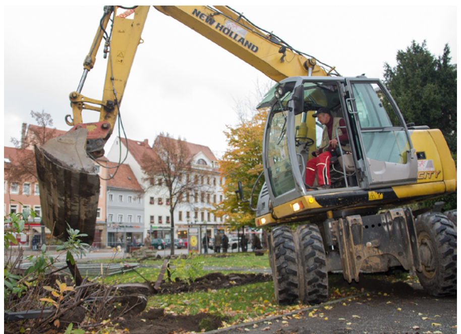
Baustart am Friedenspark

Im Aktivbereich im hinteren Teil des Parks ist ein neuer „Geschichtenspielfeld“ geplant. Dieser ist dem Thema Seilerei gewidmet, da sich am dortigen Standort einst auch eine Seilerei befand. (JNi)