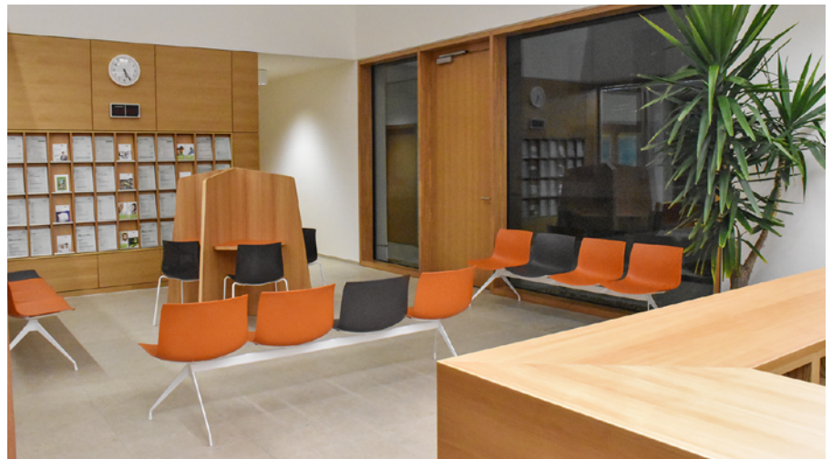
Wartebereichs des Finanzamtes

Markus Kallinke, LSF – Landesamt für Steuern und Finanzen