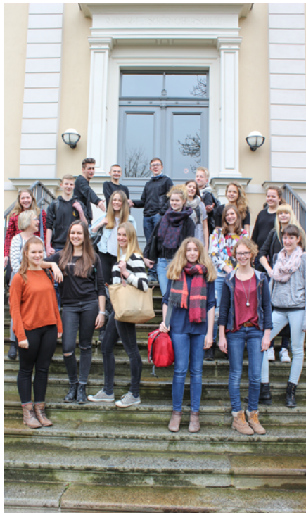
Schülerinnen und Schüler des Schiller-Gymnasiums