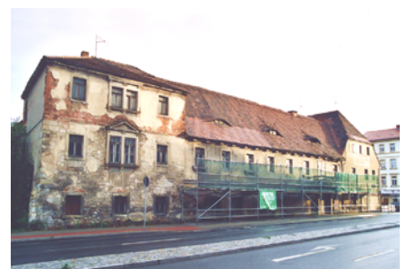
Die Gebäude der Breiten Straße 2 bis 4 vor der Sanierung

durch den Gebäudekomplex und weitere kleine Überraschungen. (JNi)