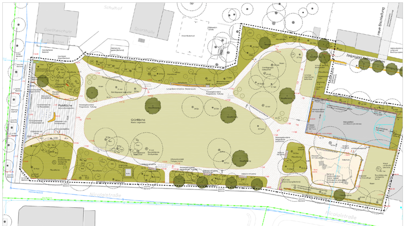
Entwurfsplanung zur Umgestaltung des Pirnaer Friedensparks (Abbildung: Stadtverwaltung)