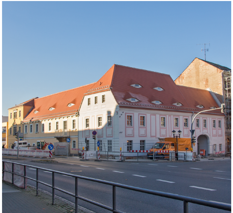
Am sanierten Gebäudekomplex der Breiten Straße 2 – 4 werden letzte Arbeiten am Fußweg durchgeführt

Varkausring 1 b, Telefon: 710213 E-Mail: stadtteilbuero.sonnenstein@pirna.de Di. 09:00 – 12:00 u. 14:00 – 16:00 Uhr Do. 09:00 – 12:00 u. 14:00 – 18:00 Uhr