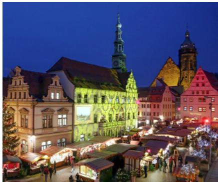
Blick über den Canalettomarkt