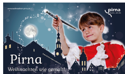
Das Gesicht der Weihnachtskampagne

Die Advents- und Weihnachtszeit ist in Sicht! Damit kann die von der SEP betreute Weihnachtskampagne an den Start gehen. In erster Linie steht hinter der Kampagne die Idee, die Marketingkräfte der Akteure zu bündeln und damit in ihrer Wirkung