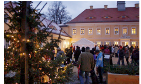
Weihnachtlicher Innenhof des Jagdschlusses

Der große Innenhof mit Remise und Tene, der Saal und das Gesellschaftszimmer erwarten die Gäste im weihnachtlichen Ambiente. Geboten werden ein umfang-