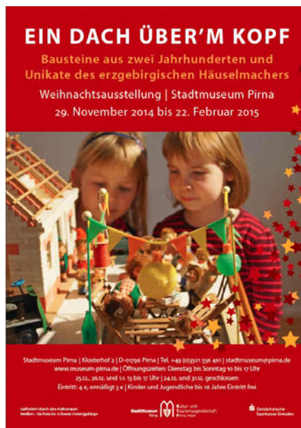
Weihnachtlicher Innenhof des Jagdschlusses

Kultur- und Tourismusgesellschaft Pirna mbH