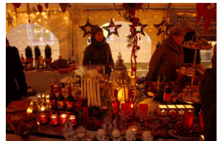
Geschenkideen zum Weihnachtsfest

reiches Rahmenprogramm, interessante Geschenkideen, Spielangebote für Kinder, eine Kindereisenbahn und leckere Speisen und Getränke. Der Eintritt in das Jagdschloss ist an diesem Nachmittag frei. Kostenlose Führungen durch die Ausstellung werden 14:30 Uhr und 16:30 Uhr angeboten.