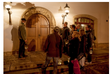
Lichtelführung durch Pirnas Altstadt