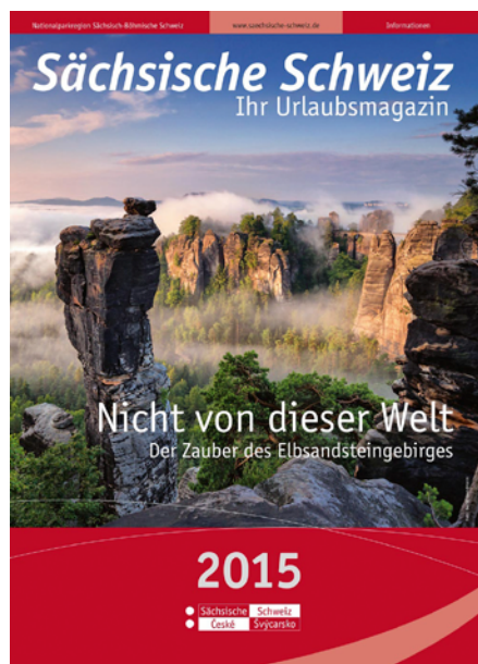
Naturwunder Elbsandsteingebirge (Titel: Tourismusverband Sächsische Schweiz e.V.)

Tourismusverband Sächsische Schweiz e.V.