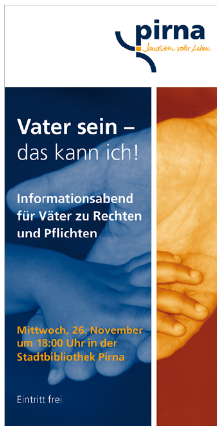
Flyer zum Infoabend für Väter