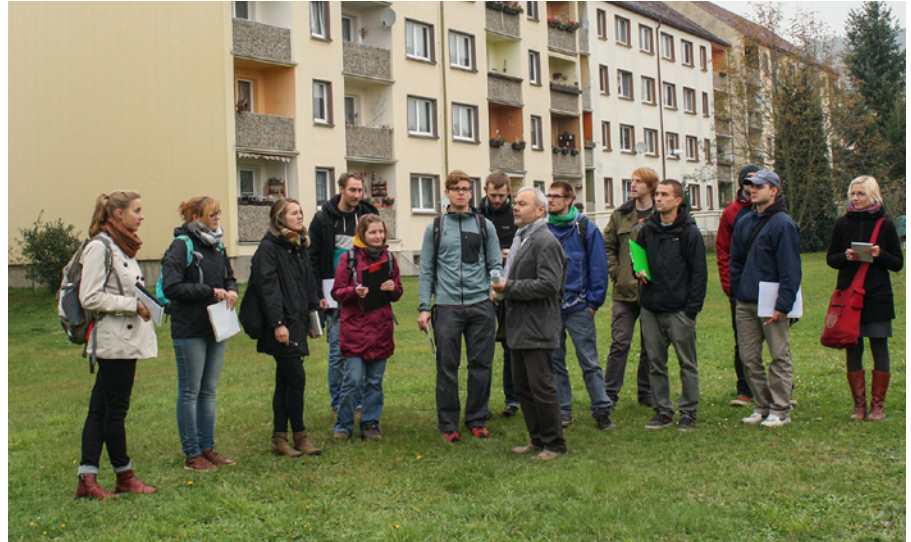
HTW-Studenten beim Vor-Ort-Termin zum Projektstart in Graupa

In Kooperation mit der Städtischen Wohnungsgesellschaft Pirna mbH (WGP) entwickeln Studenten der Fakultät Landbau/Landespflege der Hochschule für Technik und Wirtschaft Dresden (HTW) in den nächsten Monaten Ideen zur Freiraumgestaltung im August-Röckel-Ring, im Pirnaer Ortsteil Graupa. Am 30. Oktober 2014 fand vor Ort in Graupa eine Auftaktveranstaltung statt, an der die Studenten das Gebiet erstmals besichtigten und Vertreter der WGP zu verschiedenen Fragen konsultieren konnten. Die Studenten verschafften sich einen Überblick über das Gebiet, die Bebauung und die bereits vorhandenen landschaftsgärtnerischen Gestaltungen. In einem ersten Arbeitsschritt werden die Studenten den Bestand im August-Röckel-Ring erfassen und visuell darstellen. Anschließend sollen nachhaltige Ideen zur Verbesserung der Gestaltung