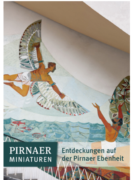
4. Ausgabe der Reihe Pirnaer Miniaturen (Titel: Kuratorium Gedenkstätte Sonnenstein e. V.)

Die Pirnaer Miniaturen sind eine Schriftenreihe, in der interessante Gebäude, Anlagen und Denkmäler der Stadt Pirna und ihrer unmittelbaren Umgebung, aber auch historische Ereignisse und kulturhistorische Themen in Wort und Bild vorgestellt werden. Das nunmehr vierte Heft von Dr. Boris Böhm widmet sich der Landschaft, geschichtlichen Spuren und Bauwerken auf der Pirnaer Ebene außerhalb des Bereichs von Festung und Heilanstalt Sonnenstein. Es verweist auf zahlreiches Entdeckungswertes jenseits der prägenden, aber doch eher monotonen Plattenbauten des Sonnensteiner Wohngebietes. Die neue Publikation wird am Dienstag, dem 25. November 2014 um 14:30 Uhr im Soziokulturellen Zentrum auf dem Sonnenstein öffentlich präsentiert.