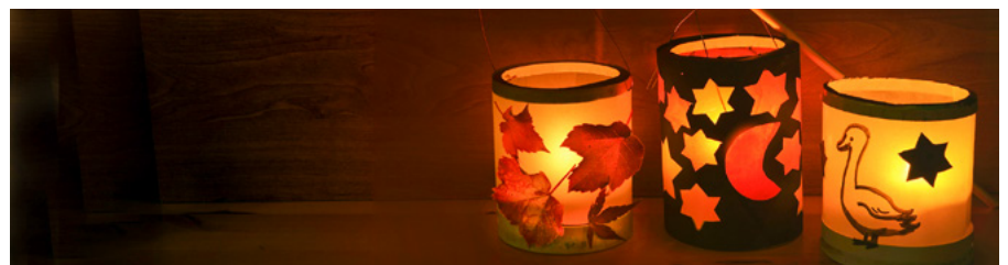
In den Stadtteilen Copitz und Sonnenstein wird wieder zu traditionellen Umzügen eingeladen