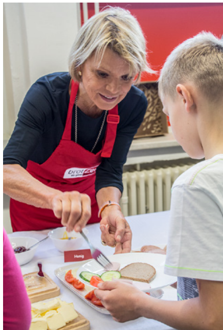
Schauspielerin Uschi Glas bereitete zum Projektstart den Schülern ein gesundes Frühstück

Aktuell suchen wir für eine Grundschule in Pirna Engagierte, die Freude daran haben, für die Schulkinder ein Frühstück zuzubereiten. Für Ihre ehrenamtliche Tätigkeit erhalten Sie eine Aufwandsentschädigung. Für nähere Informationen kontaktieren Sie bitte: