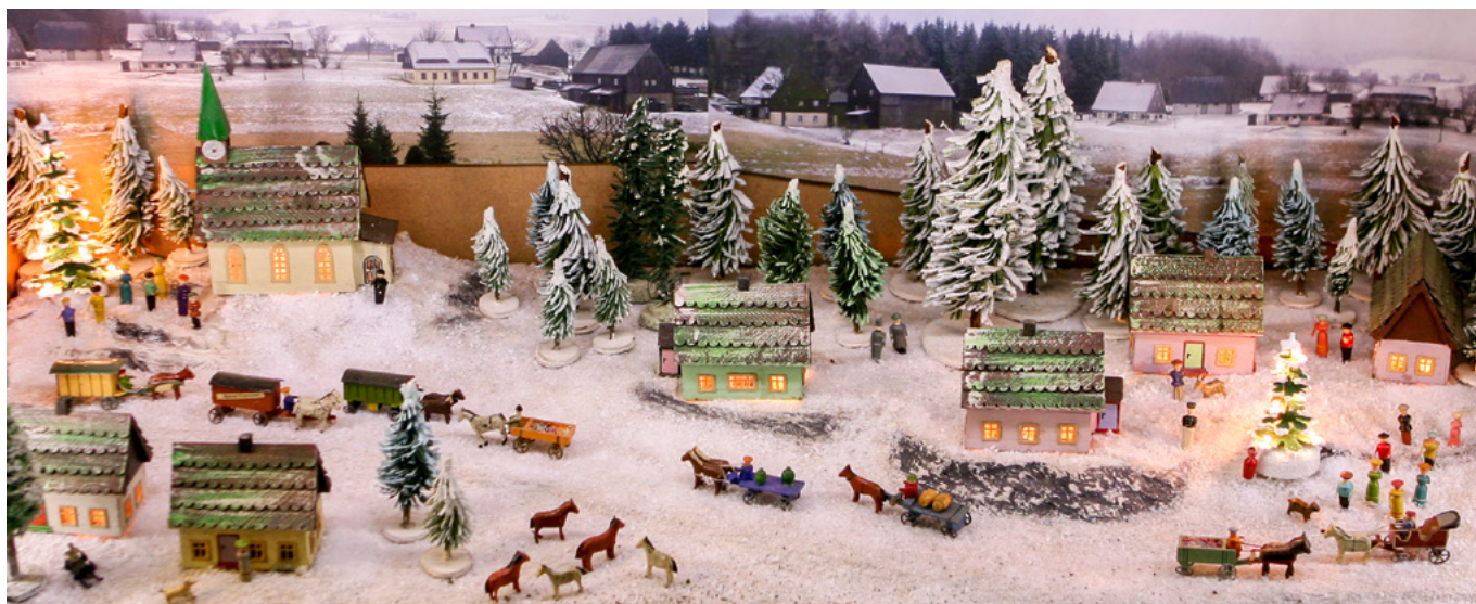
Seiffner Häuser im Winter