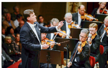
Christian Thielemann