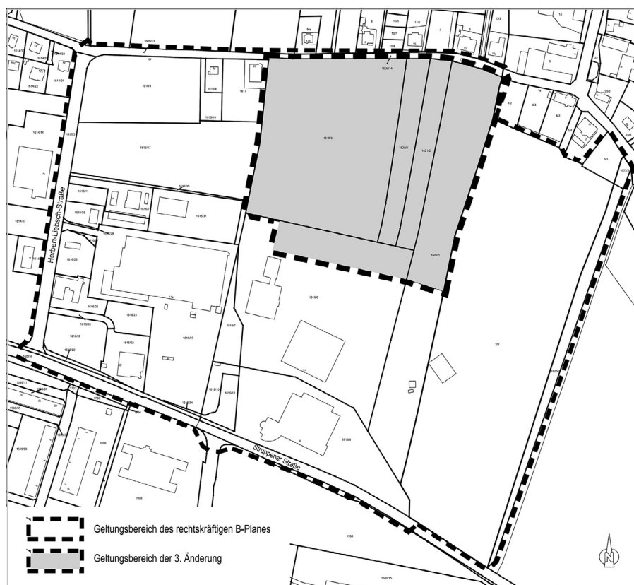
Anlage 1 zur BVL-17/0725-61.1 (B-Plan: Stadtverwaltung)

2. Die Aufstellung des Bebauungsplanes Nr. 4.3 „3. Änderung des Bebauungs-