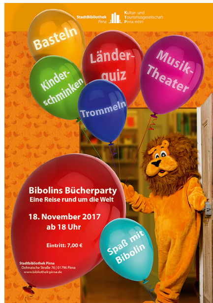
Plakat Bibolins Bücherparty