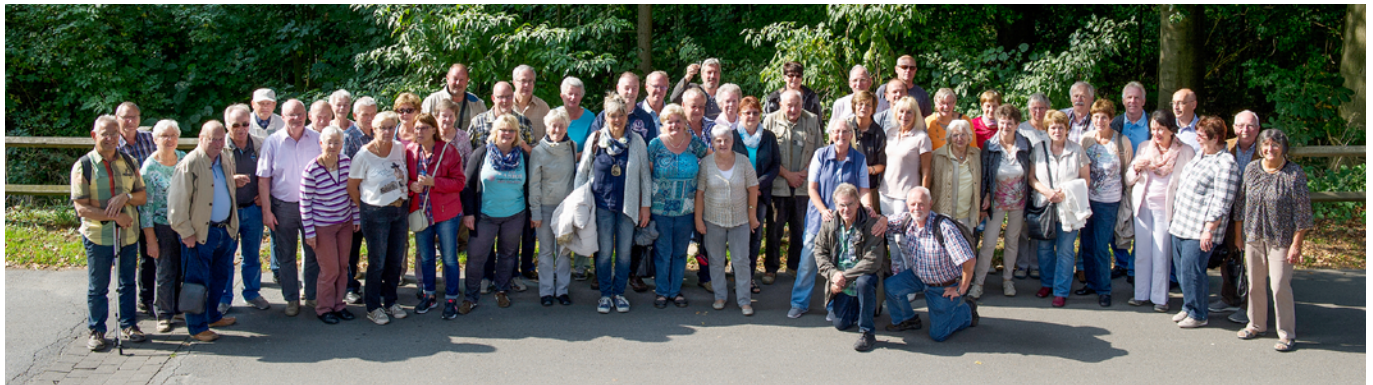
25. Partnerschaftstreffen zwischen Dröschede und Pirna