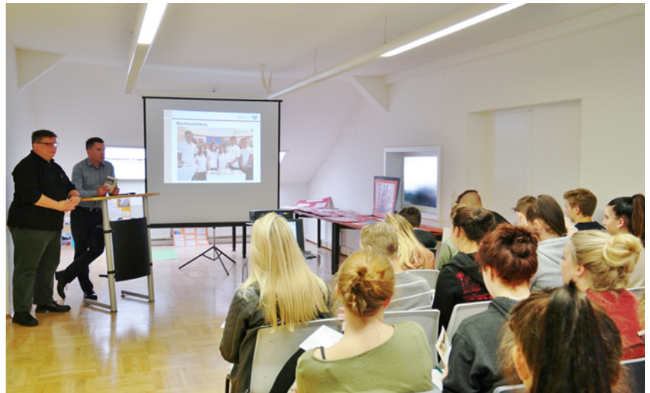
Vortrag zum Projektauftritt

Die Stadtwerke Pirna GmbH lässt seit dem 24. Oktober das Abwasserpumpwerk auf der Borsbergstraße Ecke Kastanienallee in Graupa umsetzen. Bei den dazu notwendigen Kanalarbeiten müssen ca. 30 m Schmutzwasserhauptkanal DN 200 und die Druckrohrleitung DN 80 neu verlegt werden. Grund für die Umsetzung des Pumpwerkes ist der derzeitige Standort des Bauwerkes auf einem privaten Grundstück. Während der Arbeiten sind folgende Verkehrseinschränkungen und Umleitungen geplant: Die Borsbergstraße wird im Baustellenbereich halbseitig gesperrt. So wird die Straße zwischen Kastanienallee und Gärtnerweg nur einspurig in Richtung Kastanienallee befahrbar. Der Verkehr in Richtung Ortsmitte wird über die Lindenallee umgeleitet. Entsprechende Umleitungen werden ausgewiesen. Für den Busverkehr werden zwei zusätzliche Haltestellen an der Kastanienallee und auf der Lindenallee eingerichtet. Die Fertigstellung der Maßnahme ist für den 16. Dezember 2016 vorgesehen. Mit der Bauausführung hat die Stadtwerke Pirna GmbH die Firma Sebnitztalbau GmbH beauftragt. Wir bitten die Beeinträchtigungen zu entschuldigen. Für Rückfragen stehen die Mitarbeiter der Stadtwerke Pirna GmbH unter der kostenlosen Servicenummer 0800 5891403 gern zur Verfügung. (UUI)