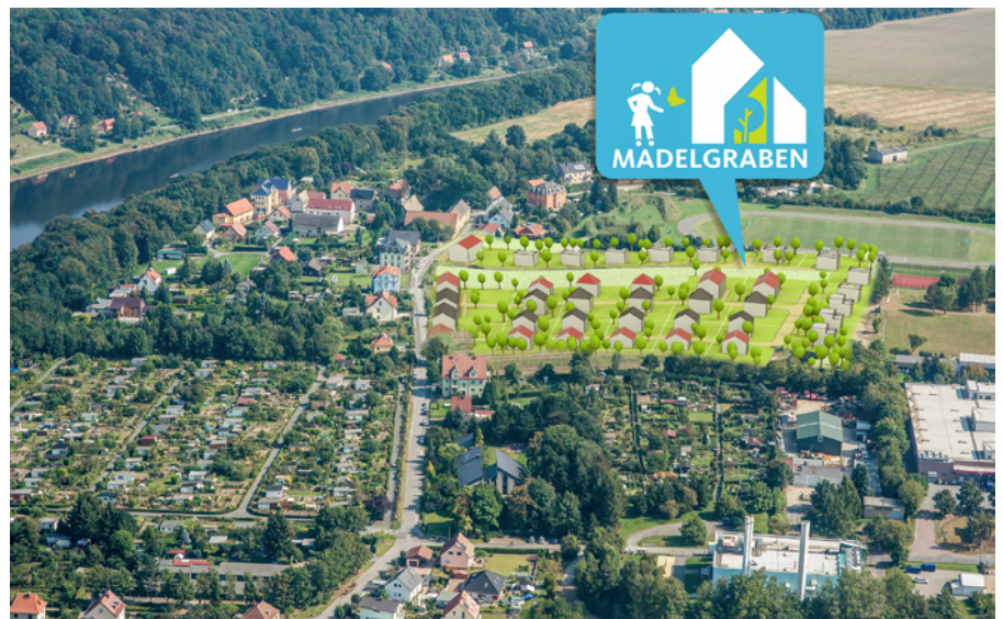
Zukünftiges Wohngebiet Mädelgraben

Nach der erfolgreichen Vermarktung des Wohnparks Vogelwiese geht die Stadtentwicklungsgesellschaft nun bereits mit ihrem nächsten Projekt an den Start. Auf 36 Baugrundstücken können im Wohngebiet Mädelgraben ab Mitte des nächsten Jahres Einfamilienhäuser, aber auch zwei Doppelhäuser bzw. vier Mehrfamilienhäuser entstehen. Die Vorbereitungen dazu laufen schon seit einiger Zeit; so ist der Bebauungsplan auf den Weg gebracht, der Entwurf hat bereits öffentlich ausgelegen. Es können sowohl Gebäude in ein- bis zwei-geschossiger Satteldachbauweise, aber auch moderne meist zwei-geschossige Flachdachhäuser entstehen, einzelne Grundstücke ermöglichen eine Bungalowbauweise. Die zwischen 620 und bis zu 900m 2 großen Grundstücke bieten für jeden Interessenten etwas. Ab Januar soll dann auch der Bau der inneren Erschließung beginnen, über zwei Anlieger-