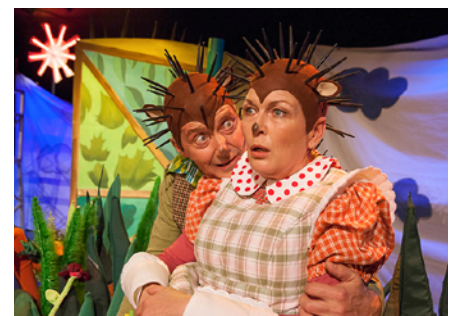
Hase und Igel

Eintritt: 12 €, ermäßigt 9 €, Einlass: 15:30 Uhr