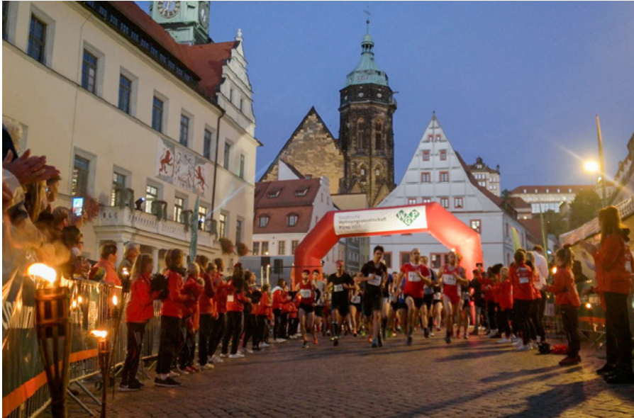
Einzelläufer des Rundkurses queren den Marktplatz