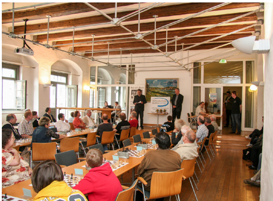
... spielen eine Partie Schach: Über 50 Mitspieler verschiedener Nationen streben nach kurzen Mattpartien