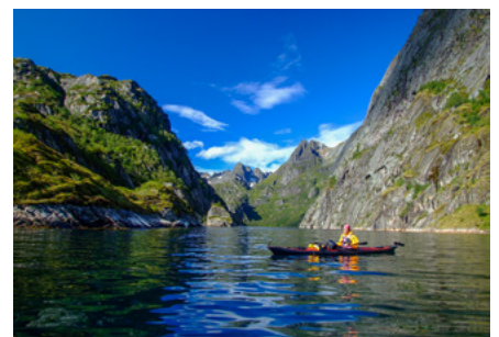
Reisevortrag Norwegen und Schweden

In seiner Bayerischen Heimat genießt der „Fränkische Indiana Jones“ längst Kultstatus. Nun ist er erstmals zu Gast in Pirna mit einer seiner verrückten Reisen. Verrückt sind aber nicht nur seine Reisen, sondern irgendwie auch seine Filme, die so ganz anders sind als viele Vorträge, die man sonst kennt. „Mein Publikum muss leiden“, so lautet sein berühmtes, nicht ganz wörtlich zu nehmendes Vortragsmotto. Die Kombination aus packenden Filmaufnahmen, humorvollen Live-Kommentaren und Hintergrundinformationen über Land und Leute, Reisevorbereitung und -durchführung lassen seine Vorträge zu einem unvergesslichen Live-Erlebnis werden.