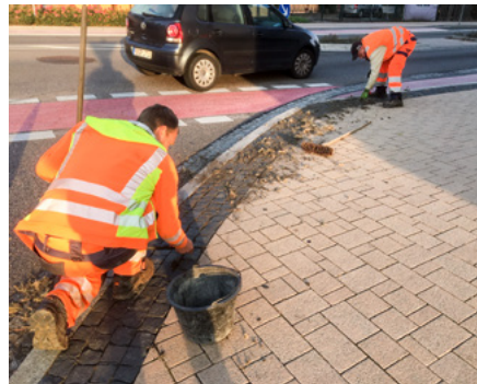
Sorgen für Sauberkeit im Stadtteil Copitz: Die Mitarbeiter des städtischen Bauhofes reinigen und kehren die Hauptstraße