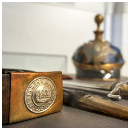
Exponate der Ausstellung „Gold gab ich für Eisen“

■ Mi, 24.10. | 19:00 Uhr | StadtMuseum Eintritt: 4,00 €, ermäßigt 3,00 € Einlass 18:30 Uhr