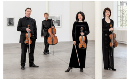
Minguet Quartett