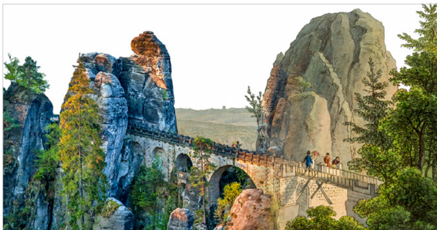
Wo Wagner weilte – Basteibrücke damals und heute

Archäologie versucht früheres Leben zu erklären. Dazu gehört auch die Rekonstruktion des Verkehrs. Welche Transportmittel benutzte man in der Vorgeschichte?