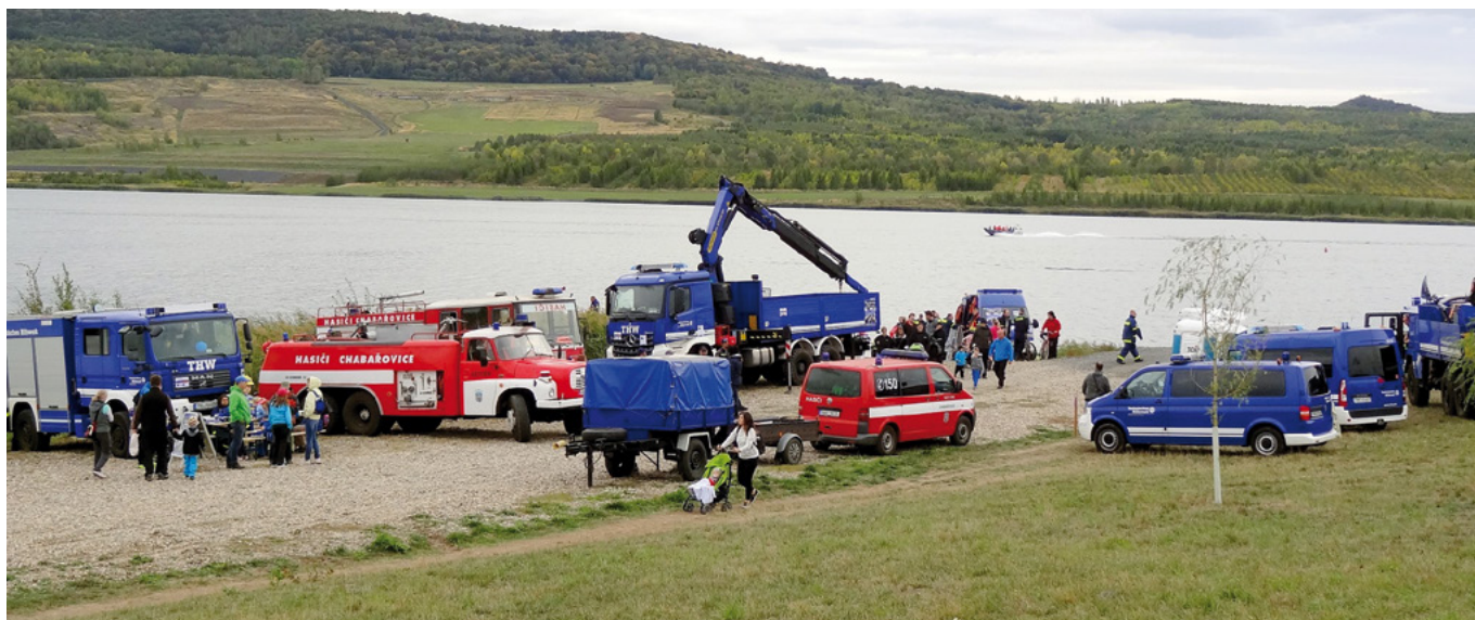
Technik der SDH Chabařovice und des THW am Ufer