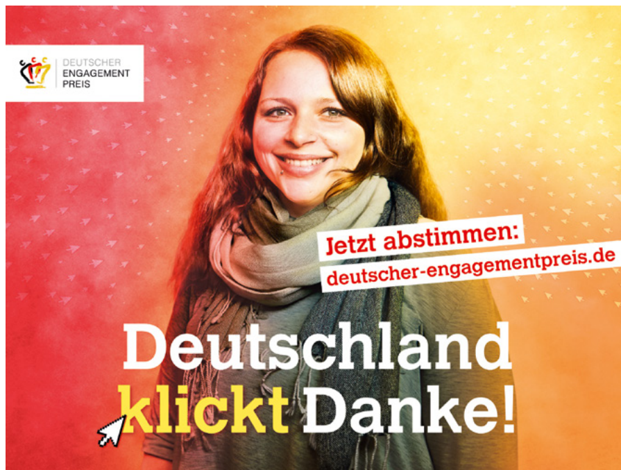
Online-Voting für den Publikumspreis 2018

Markus Winkler, Deutscher Engagementpreis