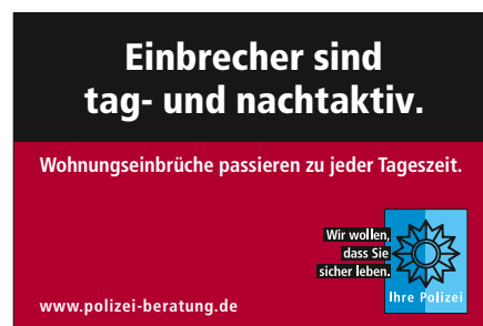
Abbildung: Polizeiliche Kriminalprävention der Länder und des Bundes