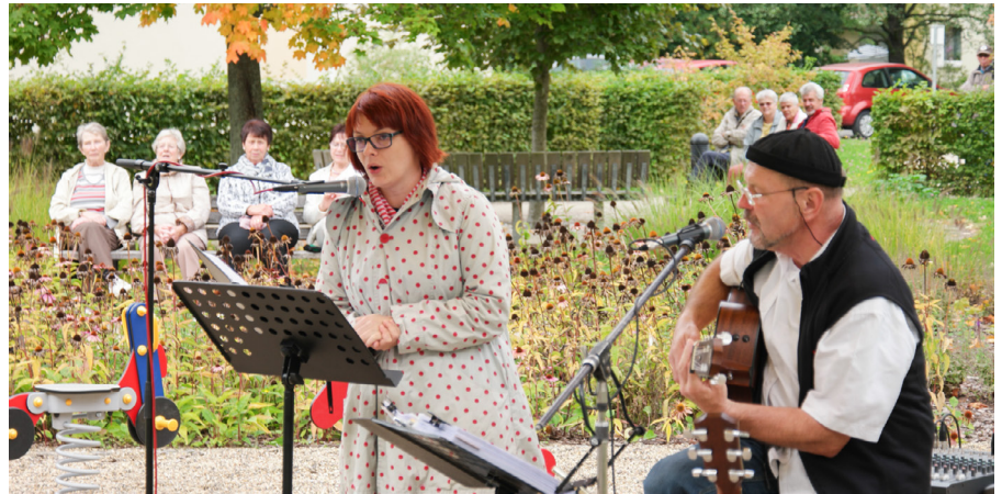
In den Sonnensteiner Höfen erklingen Herbstlieder