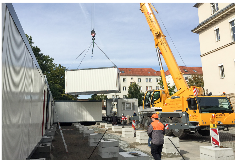
Über mobile Raumeinheiten stellt die Stadt Pirna dem Schiller-Gymnasium Ersatzklassenzimmer zur Verfügung bis der Erweiterungsbaubau errichtet ist

Insgesamt 28 vorgefertigte und weitestgehend vorinstallierte Einzelmodule lässt die Stadt zu fünf Klassenzimmern, zwei Kursräumen, entsprechenden Sanitäranlagen und einem Haustechnikraum mit einer Nutzfläche von ca. 500m 2 montieren. Die mobilen Raumeinheiten werden auf einer Fläche mit vorbereiteten Fertig-