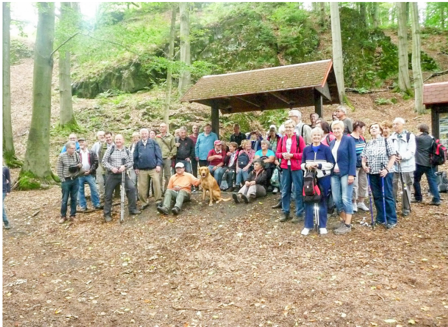
Teilnehmer der deutsch-tschechischen Freundschaftswanderung unterhalb vom Dymník – einem 516m hohen Basaltberg bei Rumburk