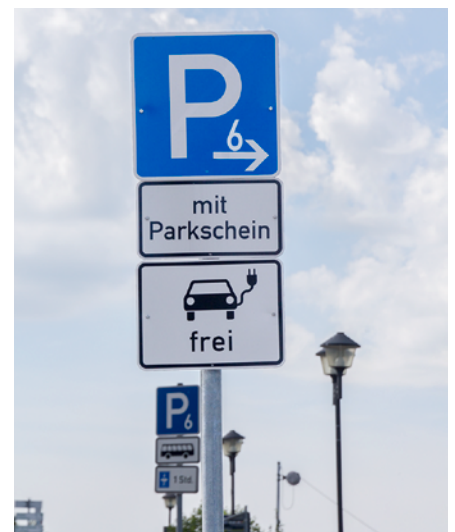
Zusatzbeschilderung für E-Autos

Auf dem Pirnaer Elbeparkplatz können Elektrofahrzeuge nun kostenfrei parken. Entsprechende Zusatzzeichen ersparen den Besitzern dieser Fahrzeuge den Kauf eines Parkscheines. Die Maßnahme ist ein weiterer Beitrag der Stadt für einen verbesserten Klimaschutz. Schon seit Längerem befinden sich auf dem Marktplatz vor dem TouristService Elektrotankstellen für Pedelecs und E-Bikes. Weiterhin wird vom 5. bis 27. Oktober eine kostenfreie Wanderausstellung „Effiziente Mobilität“ der Sächsischen Energieagentur (SAENA) im Rathaus zu sehen sein, mit welcher Basiswissen und Informationen zum aktuellen Stand und Zukunft der Themenbereiche Elektromobilität und Intelligente Verkehrssysteme vermittelt werden sollen. (TGo)