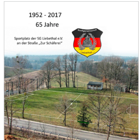
Sportplatz – Bildmontage