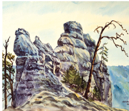
Sommerwand - Irmgard Uhlig

„Meine Heimat sind die Berge“ – es gibt keinen treffenderen Ausspruch Irmgard Uhligs zu ihrem Lebensinhalt. Ob in den Alpen, den Dolomiten, am Elbrus, in China, Bulgarien oder in den USA, stets war sie