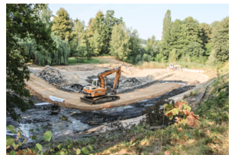
Bauarbeiten am Borsbergbad