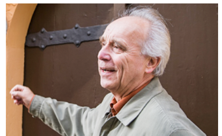
Reformation in Pirna

„Sobald das Geld im Kasten klingt, die Seele in den Himmel springt“ so lautet der Satz, mit dem Johannes Tetzel Ablasshandel in einer ganz speziellen Art und Weise betrieben haben soll, welche auch den Anlass für Lu-