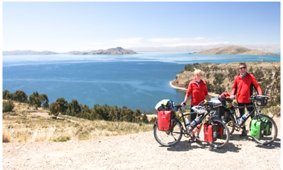
Bilder einer Auszeit