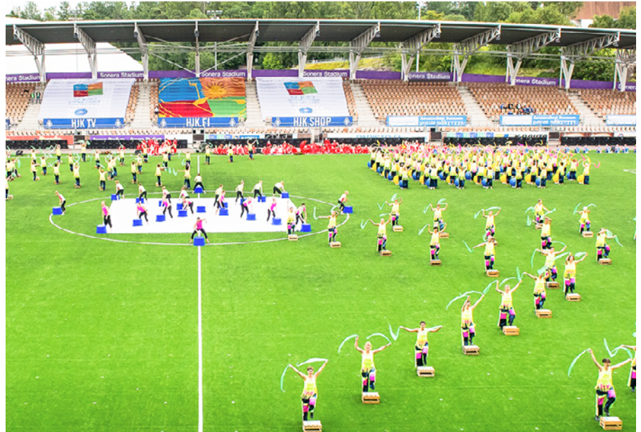
Show in Helsinki

Neben dem freudbetonten Sporttreiben standen Erfahrungsaustausch, Kommunikation und Geselligkeit im Mittelpunkt der Woche. Die Stadt Helsinki und deren nähere Umgebung wurde erkundet. Eine Schifffahrt vorbei an den vielen Inseln tat unseren strapazierten Füßen recht gut. Nach sieben ereignisreichen Tagen kehrten