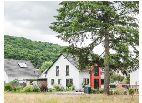
Musikerviertel erfolgreich vermarktet