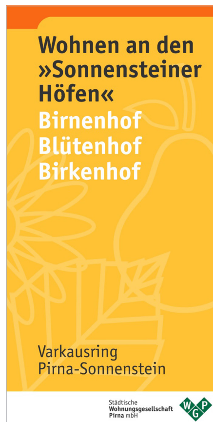
Faltblatt Sonnensteiner Höfe