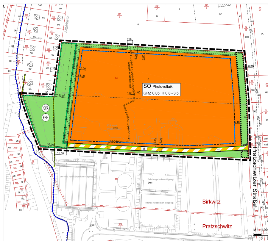
Bebauungsplan Nr. 55 „Am ehemaligen Klärwerk Pratzschwitz“ – Rechtsplan (Planzeichnung: Stadtverwaltung)