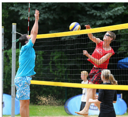
Sportlich: Teilnehmer des 5. Strandvolleyball-Turniers 2012 im Geibelt-Freibad Pirna

Als Sponsor ist Margon beteiligt. Auch den Zuschauern und Badegästen wird an diesem Tag viel Abwechslung geboten. So laden verschiedene Sport-Angebote zu Aktivität rund um den Volleyball-Cup ein. Außerdem können sich die Besucher in den verschiedenen Innen- und Außenbecken des Geibeltbades abkühlen oder die abwechslungsreiche Saunawelt besuchen. Das Geibeltbad-Team freut sich auf zahlreiche Besucher und hoffentlich gutes Sport- und Beachwetter! Ausführliche Informationen erhalten interessierte Besucher unter www.geibeltbad-pirna.com . (Slr)