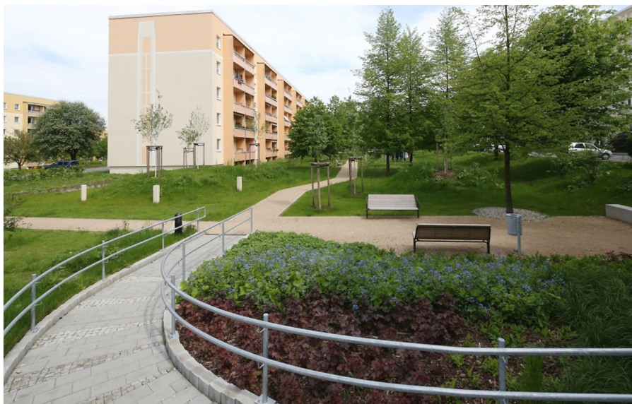
Neben den Birken wurden im Themenhof auch einige Staudengewächse angepflanzt. Ruhebereiche mit Bänken laden Bewohner und Gäste zum Verweilen ein.

Die Hänge-Birke, auch Sandbirke, Weißbirke oder Warzenbirke genannt, ist eine Birkenart mit schlankem, elegantem Wuchs, ihr zartes Frühlingsgrün macht sie zum Frühlingsymbol. In Skandinavien und Russland hat sie im Volksbrauch eine ähnliche Rolle wie die Linde und die Eiche in Deutschland. Die Sand-Birke wurde im Jahr 2000 Baum des Jahres.