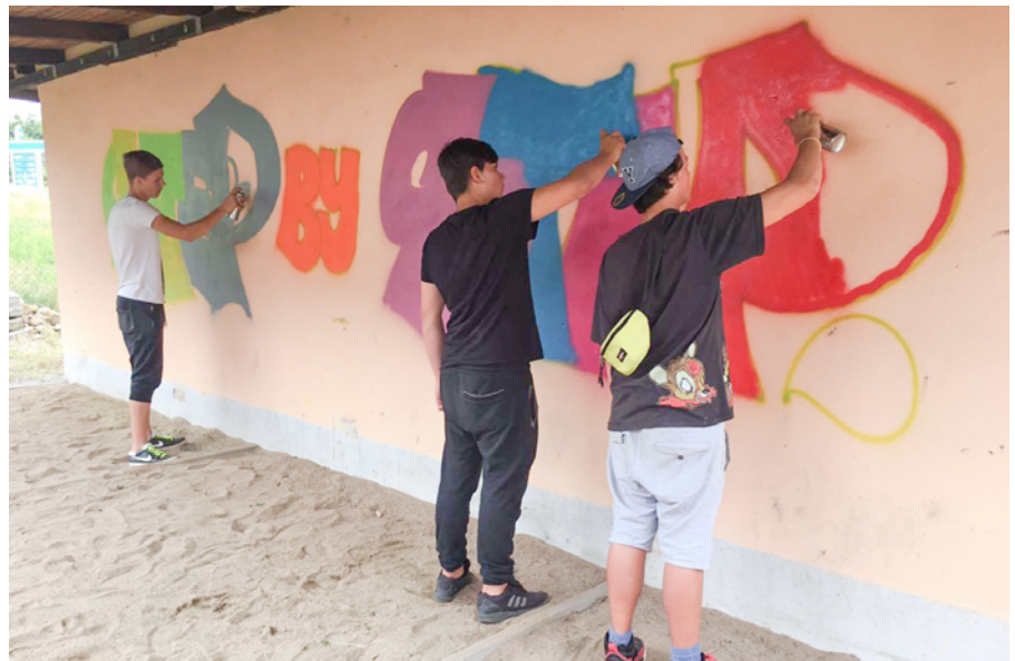
Neuer Schriftzug am Lagerraum der ASG