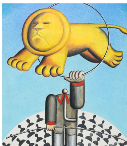
Hans Ticha, Der Löwe (Foto: Frank Füssel)

Das Stadtmuseum Pirna zeigt in der Sonderausstellung bis zum 31. Oktober Werke der bildenden Kunst, die der Sammler Wolfgang Finkbein aus Dresden zur Verfügung stellt.