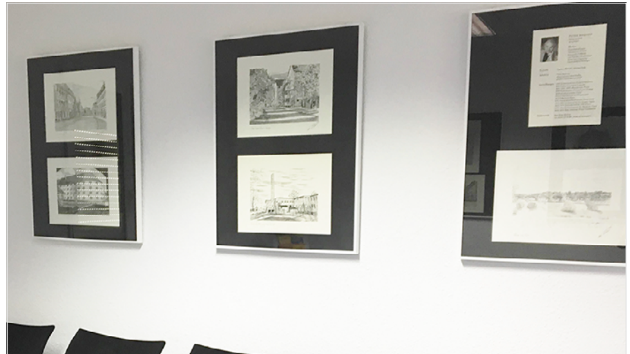
Zeichnungen des Pirnaer Künstlers Peter Richter

beispielsweise das „Rundhaus“, die Pestalozzi-Oberschule oder die „Schöne Höhe“. Die Ausstellung kann während der Bürozeiten, dienstags und donnerstags, jeweils in der Zeit von 9 – 12 und 14 – 18 Uhr besichtigt werden. (SSa)