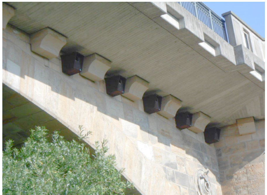
Das Pirnaer Dohlen-Domizil - An der Pirnaer Stadtbrücke auf Copitzer Seite hat eine hohe Dohlen-Population schon seit den 90er Jahren ihr Zuhause. Die Stadt Pirna lässt nun zwei weitere Nistkästen anbringen, damit alle Unterschlupf finden.

Mit dem Beginn der Arbeiten Mitte August folgt die Stadt den Auflagen der Unteren Naturschutzbehörde, die hohe Dohlen-Population, die sich in den Nistkästen auf Copitzer Seite niedergelassen haben, nicht zu stören. Die Tiere stehen unter Artenschutz. Seit der Sanierung der Stadtbrücke 1993 bis 1995 befinden sich auf östlicher Seite unterhalb der „Kappe“ des Bauwerkes fünf bei den Vögeln äußerst begehrte Nistkästen. Diese reinigt und