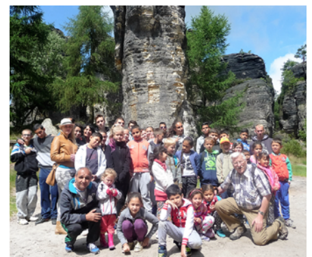
Die Kinder des Integrativen Ferienlagers erkunden das Tisaer Labyrinth

die Pirnaer Klaus Fiedler und Helmut Hauswald