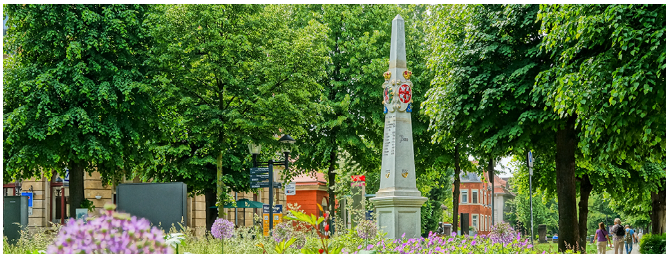
Pirnaer Postmeilensäule an der Grohmannstraße