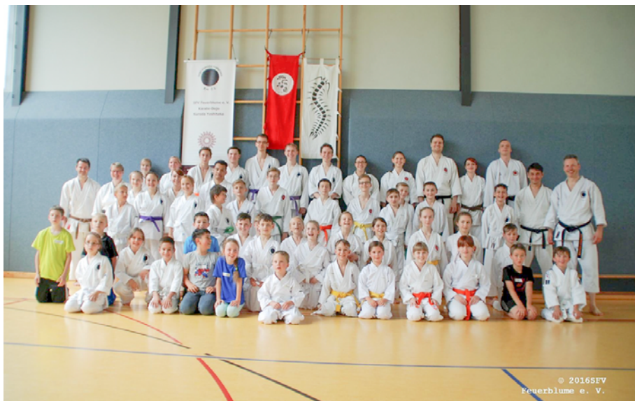
Die Camp-Teilnehmer des SFV Feuerblume e.V., Takeda (Auerbach), Torii (Dresden) und Bewusst leben (Königstein)

Zu unserem 3. Kinder- und Jugendcamp konnten wir am 18. Juni neben Mitgliedern unseres Vereins (SFV Feuerblume e.V.) auch junge Karateka von den Vereinen Takeda (Auerbach), Torii (Dresden) und Bewusst Leben (Königstein) begrüßen. Insgesamt 45 Kids von 6 bis 17 Jahre traten um 13:30 Uhr zum ersten Training an. Pünktlich zum Beginn des Trainings donnerte es und der Himmel öffnete seine Schleusen. Die Erwärmung in der Halle begann ohne die Karatekas von Takeda, diese standen auf der A4 im Stau und kamen erst zur Trinkpause dazu. Das Training wurde dann in Gruppen (Kata, Selbstverteidigung, Fallübungen, allgemeine Koordination) aufgeteilt. In den Pausen versorgten unsere Helfer die Kids mit Essen und Trinken. Nach dem Trainingsende um 18:30 Uhr folgte die nun schon traditionelle Wasserbombenschlacht, danach Duschen und Abendessen. Nach dem obligatorischen Film und einer kurzen Kata-Einheit für die Größeren hieß es Licht aus und schlafen. Unser zweiter Camp-Tag begann dank fleißiger Helfer mit einem ausgiebigen Frühstück. Das Wetter spielte mit, sodass wir Tische und Bänke draußen aufstellen konnten. Um 9 Uhr ging es dann los mit einer gemeinsamen Erwärmung, danach wurde die Halle geteilt. Die „Bärchen“ (unsere Kleinsten ohne Kyu) kämpften sich im KO-System über einen Hindernisparcours, für die größeren (ab 9. Kyu) ging es im Kata-Wettbewerb um Punkte.