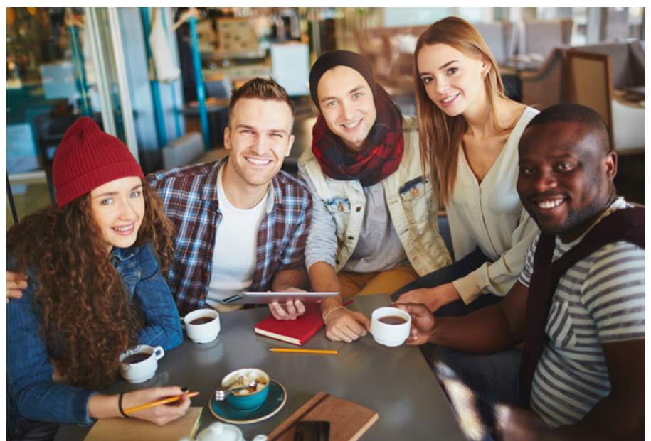
Pirnaer Tandem – Integration durch persönliche Begegnung