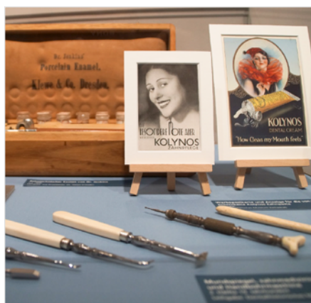
Zahnpflege anno dazumal

Die aktuelle Sonderausstellung der Richard-Wagner-Stätten Graupa, die den Titel „Dem Meister ins Maul geschaut“ trägt, endet am 14. August 2016. Bis dahin haben Interessierte die Gelegenheit, die Verbindung von Zahnmedizin und Richard Wagner zu erkunden. Die Ausstellung widmet sich beispielsweise der Frage: Was bedeutet es für einen Sänger oder einen Musiker, wenn er seine Zähne verliert? Sie zeigt darüber hinaus, welche Möglichkeiten es gab (und gibt), um zu verhindern, dass Zahndefekte oder auch nur Fehlstellungen zum künstlerischen Aus führten.