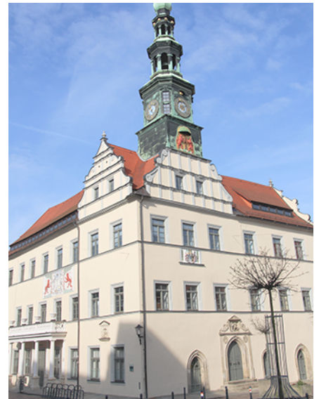
Das Pirnaer Rathaus auf dem Marktplatz

„Aus datenschutzrechtlichen Gründen wird die ‚Öffentliche Zustellung gemäß § 15 Verwaltungszustellungsgesetz für den Freistaat Sachsen (SächsVwZG)‘ nicht im Internetauftritt der Stadt Pirna veröffentlicht. Sie kann in der gedruckten Ausgabe des Amtsblattes der Stadt Pirna ‚Pirnaer Anzeiger‘ Nr. 14/16 vom 27.07.2016 nachgelesen werden.“