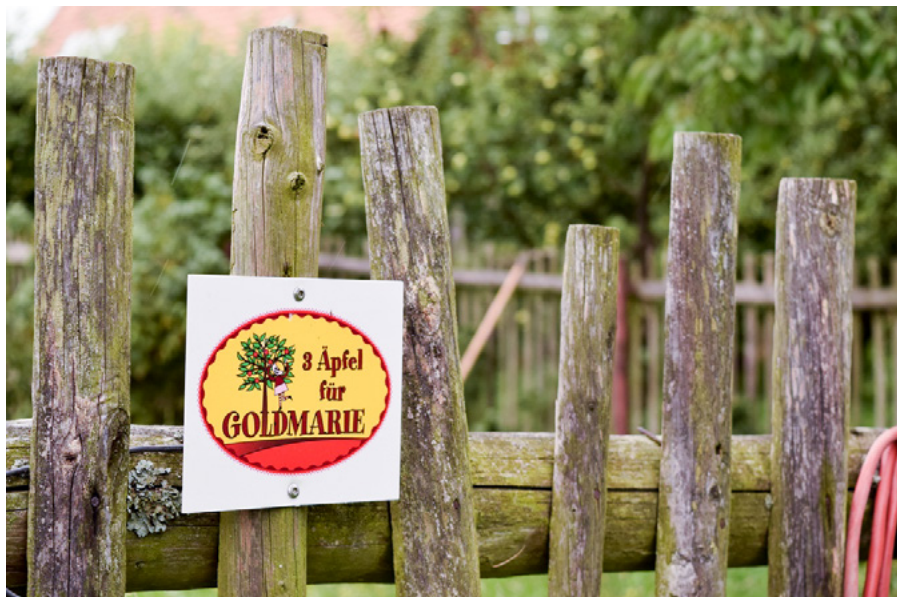
Plakette „3 Äpfel für Goldmarie“

Nach einer Auswertung aller Einsendungen setzen wir uns mit Ihnen in Verbindung. Für Ihren Beitrag erhalten Sie von uns drei hochstämmige Obstbäume gratis, die Sie auf Ihre Streuobstwiese pflanzen können. Ende Oktober ist es dann soweit. Die „Goldmarie-Bäume“ alter Sorten werden kostenfrei an Sie überreicht. Wir geben bei der Gelegenheit auch gern Informationen rund um das fachgerechte Pflanzen und wünschen einen unvergesslichen Pflanzaktionstag im Kreise Ihrer Familie und Freunde.