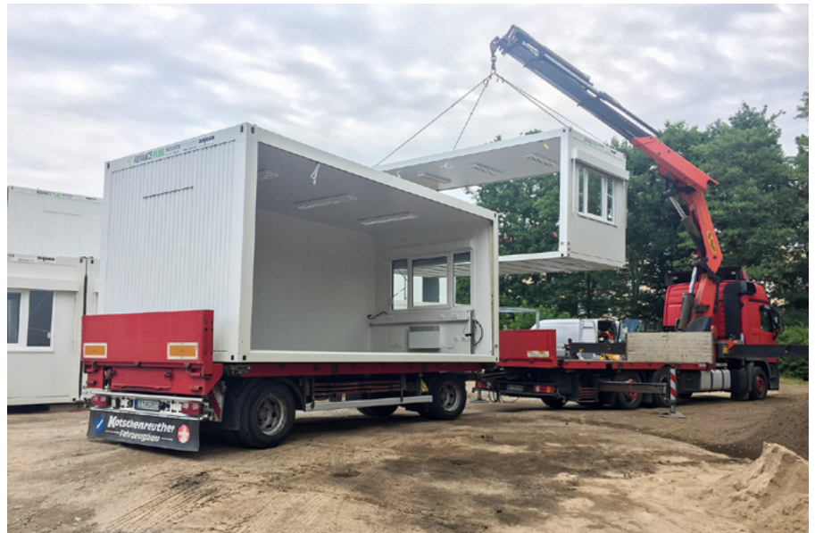
Aus insgesamt 128 Einzelmodulen lässt sich die Stadt Pirna eine Interimsschule bauen. Für ein Klassenzimmer benötigt es drei bis vier Einzelmodule.

Seit Ende Juni saniert die Stadt Pirna die Stützmauer an der Brücke über die Seidewitz im Bereich der Zufahrt zum Schloss Zehista und der Liebstädter Straße 39. Die Arbeiten dauern bis Ende Juli an. Um die Stützwand an der Brücke instand zu setzen, muss zunächst der Wasserspiegel gesenkt werden. Danach können die Arbeiter mit den Erd- und Abdichtungsarbeiten beginnen. Einschränkungen für den Verkehr wird es lediglich geringe geben: Fußgänger werden gebeten, den Gehweg an der gegenüberliegenden Fahrbahnseite zu nutzen. Für Pkw wird es kurzzeitige leichte Einschränkungen geben durch den An- und Abfahrverkehr der Baufahrzeuge von der Baustelle. Die Gesamtkosten für die Unterhaltungsarbeiten belaufen sich auf ca. 30.000 Euro. (JNi)