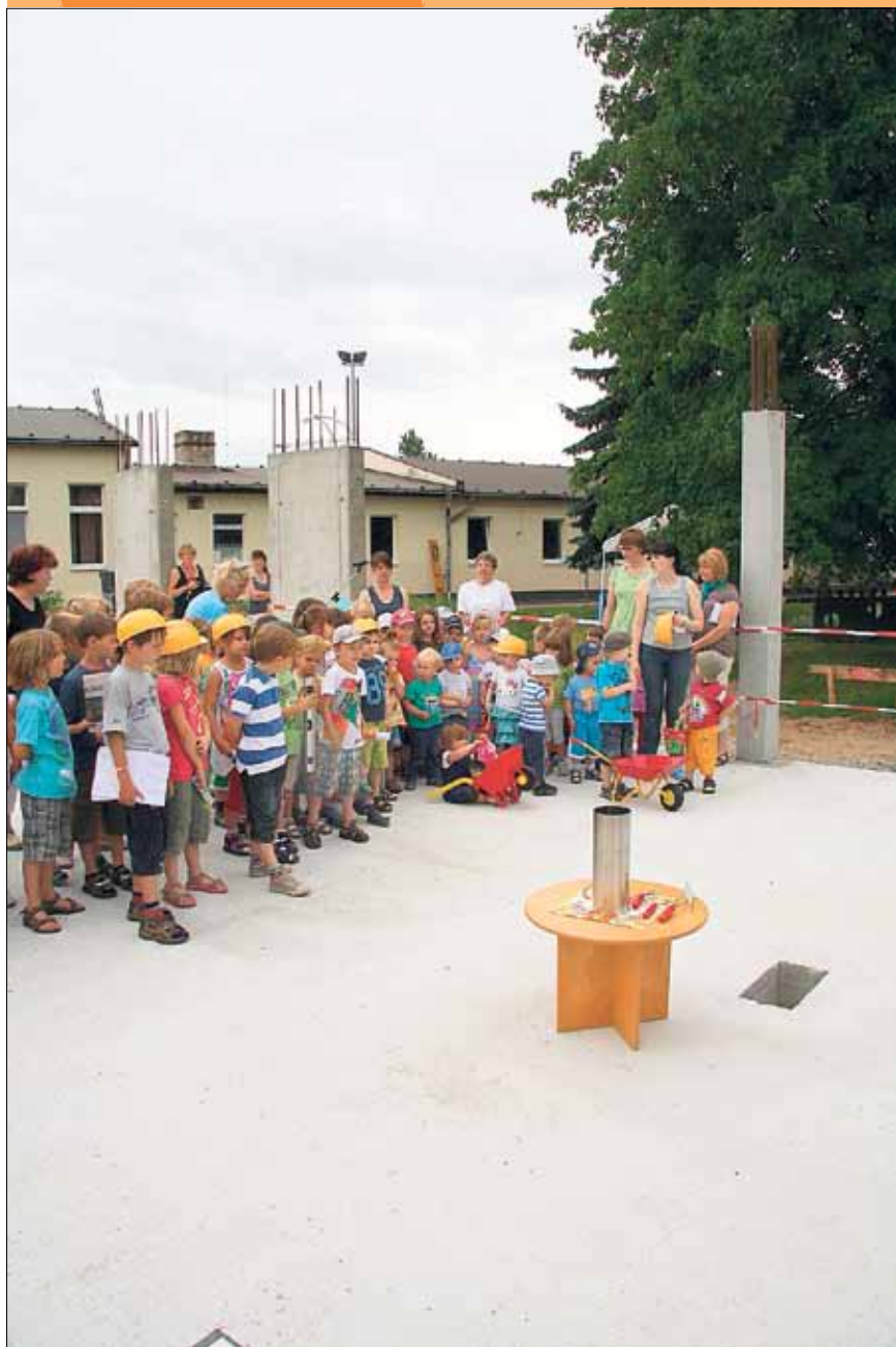
Grundstein für Kita „Zwergenhaus“ in Birkwitz gelegt

Amtsblatt der Großen Kreisstadt Pirna mit den Ortsteilen Birkwitz-Pratzschwitz und Graupa sowie der Gemeinde Dohma