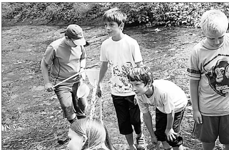
Schüler der Klasse 4a der Grundschule Pirna-Sonnenstein untersuchen den natürlichen Lebensraum der Gottleuba

Die Gemeinschaftsaktion Wasser, der zehn sächsische und thüringische Wasserversorger und Abwasserentsorger angehören, sorgt bereits seit einigen Jahren mit Aufsehen erregenden Aktionen für mehr Wissen rund um das kostbare Nass und seine aufwendige Aufbereitung zu Trinkwasser. Die sinnvolle Verbindung von Theorie, Praxis und