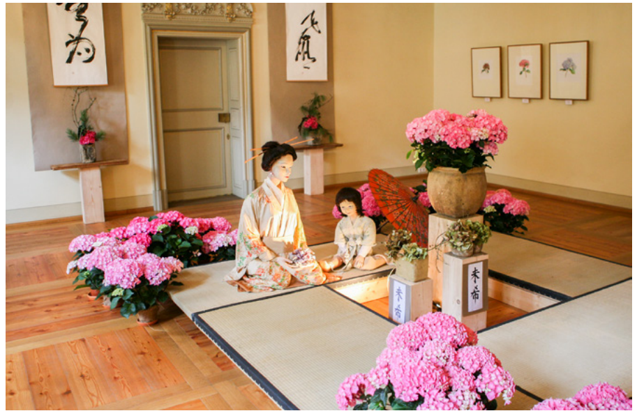
Ausgestellte Hortensie MiKi

Vermutlich fand man irgendwann zwischen diesen schirmförmigen Blütenständen einen ballförmigen (Temari-Form) und bearbeitete diesen züchterisch weiter. Ein Prozess der bis heute andauert. Diesen züchterischen Werdegang können die Besucher unserer diesjährigen Hortensienschau verfolgen. Es wird ein Sortenspektrum von sehr ursprünglichen bis zu modernen Züchtungen zu sehen sein. Ein interessanter neuer Trend sind die gefüllt blühenden Hortensien. Die Hortensie wird