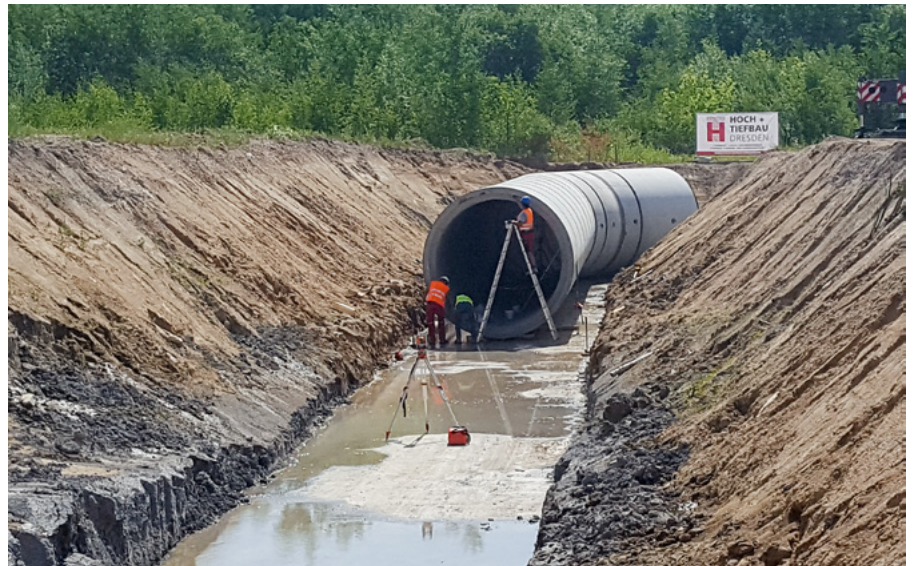
Im Gewerbegebiet Copitz-Nord verlegen Bauarbeiter einen Stauraumkanal, der später Regenwasser auffängt und ableitet.

Eine besondere Herausforderung stellt die Entsorgung des Regen- und Schichtenwassers aus dem Gebiet dar. Die Topografie und der überwiegend undurchlässige Baugrund haben in der Vergangenheit häufig