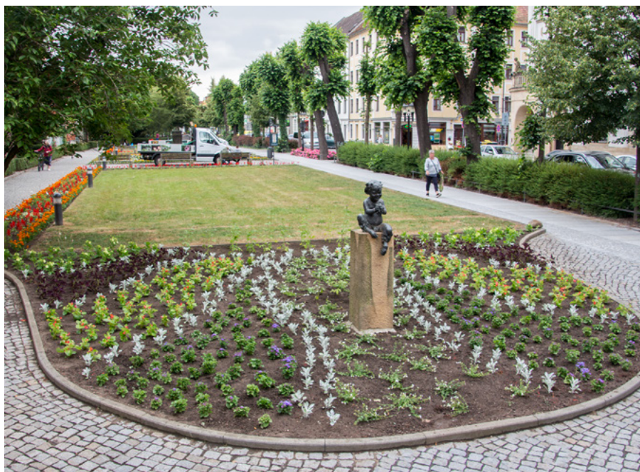
Unzählige Sommerblumen zieren nun die Grünanlagen