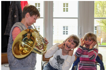
Museumsnacht – Kinder machen Musik

Die diesjährige Museumsnacht lädt ein, sich in den Klang und die Möglichkeiten der Klangerzeugung hineinzubegeben. Im Karussell der Klänge sollen alle Sinne mitspielen und dabei dürfte es überraschen,