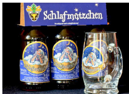
Pirnaer Unikat Schlafmützchenbier

Jeden 3. Freitag im Monat öffnet Pirna seine Schatzkiste und stellt bei einem Streifzug durch die Altstadt Pirnaer Unikate vor. Diese einmaligen Produktideen stehen in besonderer Beziehung zur Stadt Pirna, sind in Handarbeit gefertigt und zumeist aus regionalen Rohstoffen hergestellt. Die Palette reicht dabei von echter Handwerkskunst bis hin zum einmaligen Gaumenschmaus. Die Teilnehmer gehen auf 2-stündige Entdeckungstour hinter die Kulissen und erfahren Geheimes und Heiteres rund um die Unikate. Dieses Mal ist unter anderem das Schlafmützchenbier mit dabei, das nur im Brauhaus Pirna