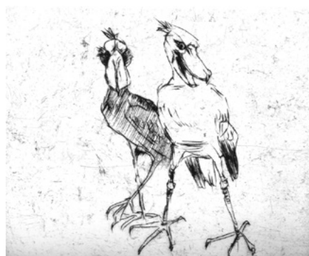
Grafik von Hans Scheib

Zum ersten Mal werden in diesem Jahr die Ausstellungsstätten im Pirnaer StadtMuseum und den Bastionen der Festung Sonnenstein verbunden. Während hoch oben über der Stadt in den Bastionen großformatige Skulpturen von Hans Scheib in einer Freiluftausstellung für die Besucher erlebbar sind, können im StadtMuseum vom 30. Juni bis 31. August, jeden Diens-