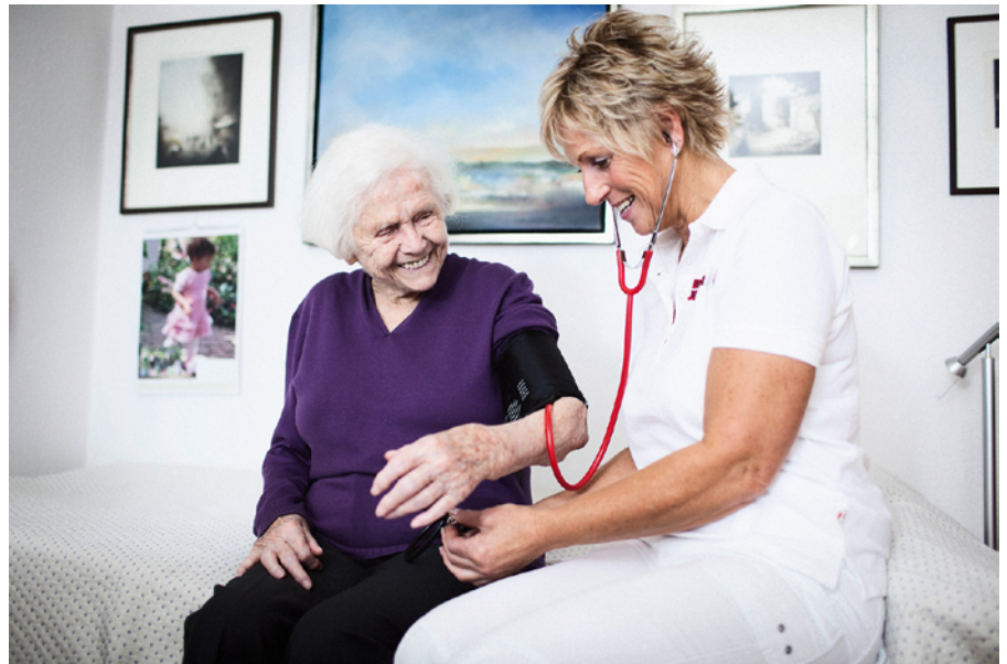
Pflegelotse der Johanniter

Pflegegeld, Pflegesachleistungen, Kurzzeitpflege oder Pflegehilfsmittel – das sind nur einige der Stichworte, die in der 20 Seiten umfassenden Broschüre erläutert werden. Wie stelle ich einen Pflegeantrag? Wie wird Pflegebedürftigkeit festgestellt, und worauf ist bei der Begutachtung zu achten? Diese und viele weitere Fragen beantwortet der übersichtliche Ratgeber und bezieht dabei die jüngsten Entwick-