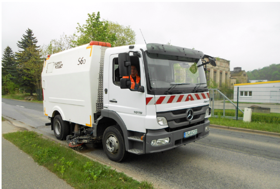
Kehrmaschine auf der Dresdner Straße

Die große Kehrmaschine ist zunächst für ein Jahr angemietet. So lange führt der