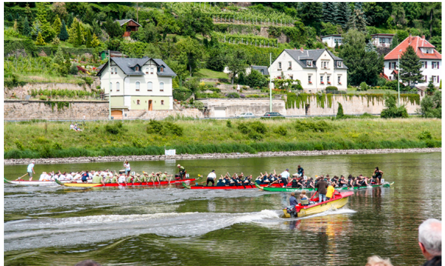
Drachenboote auf der Elbe

Varkausring 1 b, Telefon: 710213 E-Mail: stadtteilbuero.sonnenstein@pirna.de Di. 09:00 – 12:00 u. 14:00 – 16:00 Uhr Do. 09:00 – 12:00 u. 14:00 – 18:00 Uhr