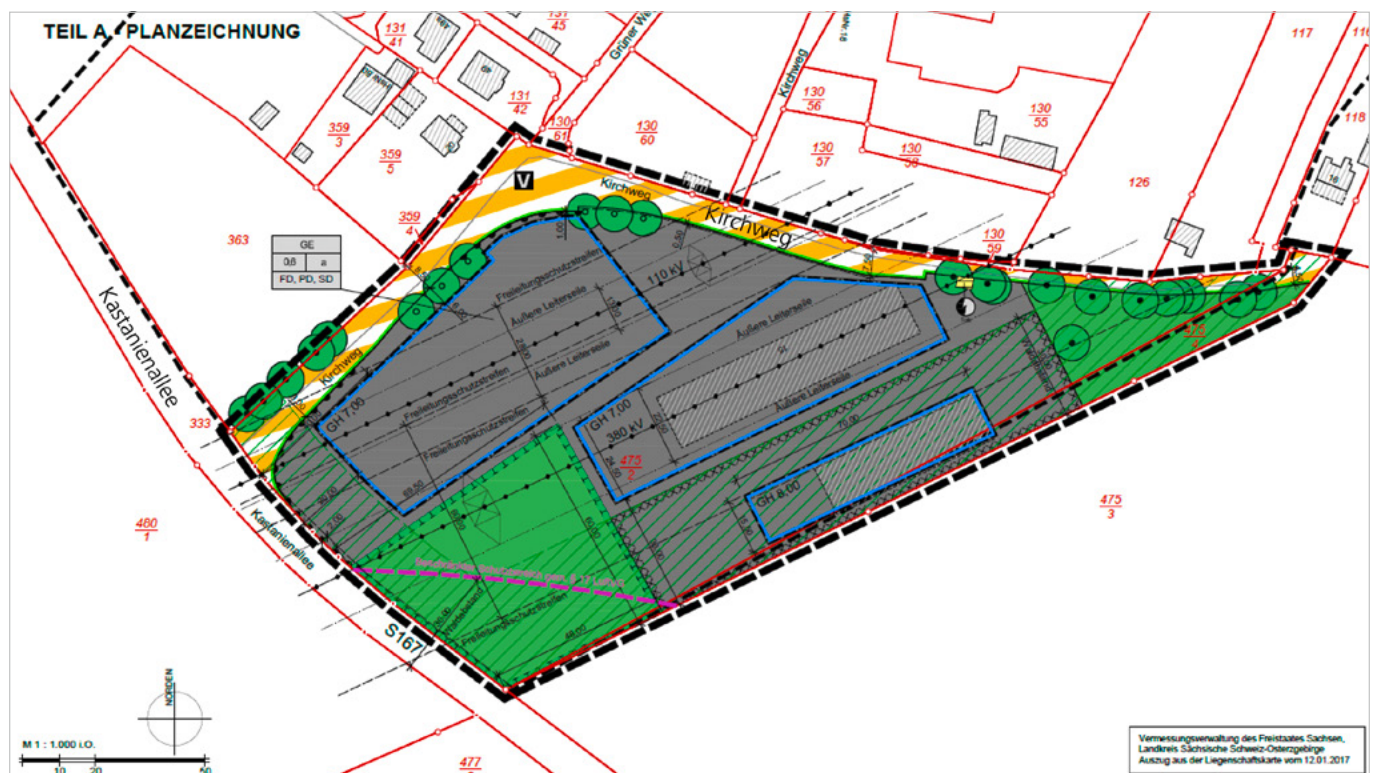
Entwurf der 2. Änderung des Bebauungsplanes Wohn- und Gewerbegebiet „Am Borsberg“

Zu den Planunterlagen des Entwurfes der 2. Änderung des Bebauungsplanes ge-