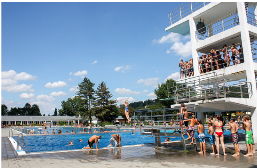
Sprungturm im Geibeltfreibad

Es ist wieder so weit. Der Sommer kommt. Am 12. Mai beginnt im Geibeltbad die Freibadsaison. Dann können sich große und kleine Wasserratten wieder im Freibad austoben. Hier fordert der gigantische 10-Meter-Turm alle Mutigen zum Sprung auf. Das 50-Meter-Schwimmerbecken lockt zu sportlicher Betätigung und zur aktiven Erholung und das Nichtschwimmerbecken lädt alle zum gemeinsamen Badespaß ein. Wer genug vom nassen Element hat, lässt einfach seine Seele baumeln. Platz dafür ist genug auf den großzügigen Liegewiesen unter den schönen großen Bäumen. Die weiträumige Außenanlage bietet zudem zahlreiche Möglichkeiten für sportliche Aktivitäten wie Beachvolleyball oder Tischtennis. Auch die Kleinen kommen nicht zu kurz. Wasser- und Matschspielplatz bieten jede Menge Abwechslung und auf den Kletterspielgeräten gibt es für kleine Seeräuber viel zu entdecken. Für 4 Euro pro Person kann man den ganzen Tag im Geibeltfreibad verbringen. Für Kinder und Jugendliche bis 15 Jahre sowie behinderte Bürger gilt der ermäßigte Tarif von 3,50 Euro. Mit der gültigen EVP +Card be-