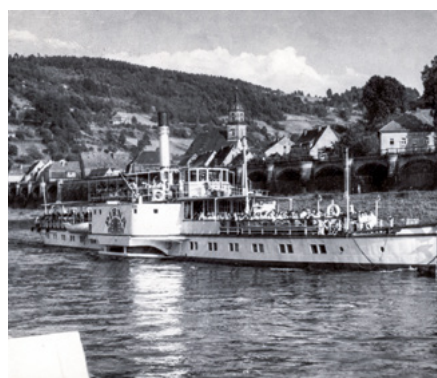
Dampfschiff „Pirna“ in Königstein 1961

Seit über 180 Jahren verkehren Schiffe der Sächsischen Dampfschiffahrts-Gesellschaft auf der Elbe und gehören damit auch zum Stadtbild von Pirna. Vor 120 Jahren wurde der Dampfer „Pirna“ in Betrieb genommen. Dieses Jubiläum war ein Anlass für vielfältige Recherchen zur hiesigen Schifffahrt allgemein und zum Jubiläumsschiff im Besonderen. Dabei kamen interessante