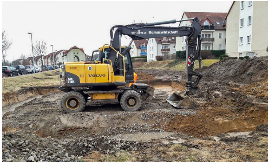
Bauland an der Reutlinger Straße