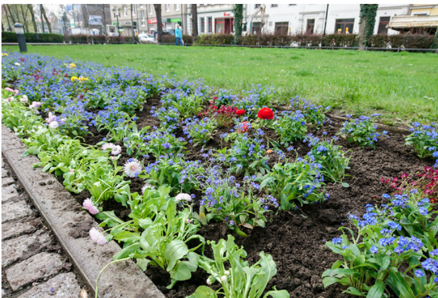
In Pirnas Innenstadt ist dank der fleißigen Gärtnerhände der Frühling eingezogen