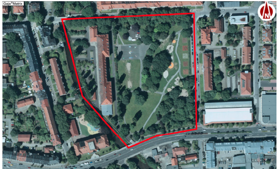
Anlage zur Polizeiverordnung vom 17.04.2018