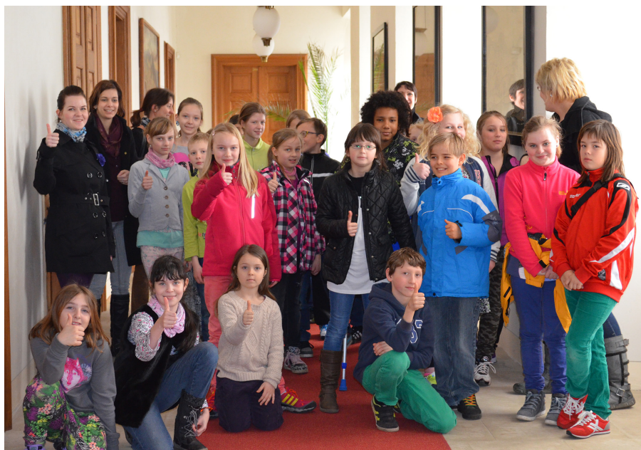
Bei einem gemeinsamen Picknick konnten die Schüler das Resultat ihrer Pflanzaktion bewundern. Beeindruckt waren die Besucher nicht nur von der Blütenpracht sondern auch von den restaurierten Räumlichkeiten des Schlosses. Ein Höhepunkt war die anschließende Besichtigung der Schule „Na Strani“. Nun freuen sich die Sonnensteiner Grundschüler der Klasse 4a auf einen Gegenbesuch.

sprechen lassen: „Sotchi war unsere erste Teilnahme an Olympischen Winterspielen überhaupt. Wir konnten viel dazulernen und werden in der nächsten Saison wieder ordentlich angreifen. Mein ganz besonderer Dank gilt den zahlreichen Unterstützern der Allianz. Herausragende Leistungen sind nur möglich mit vielen helfenden Händen, die uns im Hintergrund den Rücken freihalten.“ (JNi)