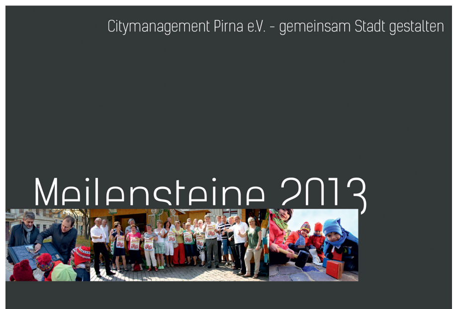
Das Jahrbuch 2013 bietet u. a. Einblicke in den Verein und die Projektarbeit (Broschüre: Citymanagement Pirna e.V.)

Am 17. März rief der Citymanagement Pirna e.V. alle Innenstadt-Akteure zusammen um über wichtige Aktivitäten und Projekte in der Pirnaer Innenstadt zu sprechen. Über 30 Händler, Gastronomen, Medienvertreter und weitere Innenstadt-Akteure folgten der Einladung. Nach vielen guten Vorschlägen, sachlichen und dennoch humorvollen Diskussionen konnten viele Festlegungen getroffen werden. Im Fokus des Treffens lag die 12. Pirnaer Einkaufsnacht. Zur Diskussion stand das Motto, unter welchem die diesjährige Einkaufsnacht stattfinden soll. Die Innenstadt-Akteure brachten viele interessante Vorschläge. Durchsetzen konnte sich jedoch vor allem ein Thema: „Rings um die Zirkuswelt“. Auch das Datum der diesjährigen Einkaufsnacht wurde gemeinsam bestätigt: Die 12. Pirnaer Einkaufsnacht wird am 12. September 2014 stattfinden. Aus diesem Vorschlag wird der Citymanagement Pirna e.V. nun ein Umsetzungskonzept erarbeiten. Aber auch andere wichtige Themen wurden gemeinsam mit den Akteuren diskutiert und erste Festlegungen getroffen: Um die Bereiche Handel und Events in Pirna noch optimaler miteinander zu verknüpfen, wurde eine Arbeitsgruppe „Händler-Events“ ins Leben gerufen. Hier wird geprüft und besprochen, welche bestehenden Events für die Händler gut