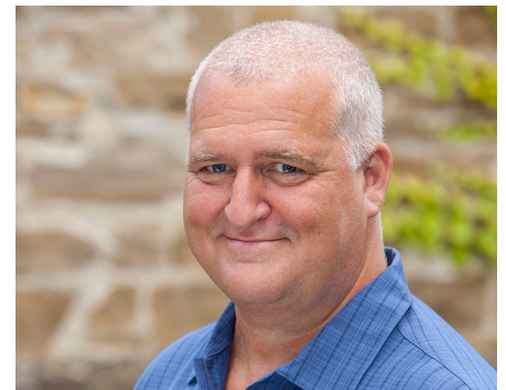
Markus Maria Profitlich

Ab 19. April gelten für den TouristService wieder längere Öffnungszeiten. Montag bis Freitag von 10:00 bis 18:00 Uhr und Samstag, Sonntag sowie Feiertag von 10:00 bis 14:00 Uhr stehen die Mitarbeiter für alle Fragen rund um die Aufenthaltsgestaltung in Pirna zur Verfügung. Wer für das Osternest noch Ideen sucht, sollte über Veranstaltungstickets nachdenken. Für die Herderhalle ist am 28. Juni ein Vortrag mit Kriminalbiologe Mark Benecke geplant und am 27. September ist Markus Maria Profitlich mit seinem derzeitigen Soloprogramm „Halbzeit“ zu Gast. Auch die