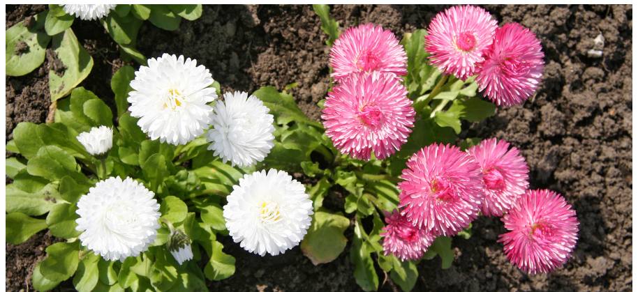
Ob Bellis, Stiefmütterchen oder Vergissmeinnicht – ca. 7.900 Blümchen arbeiten im Auftrag der Stadt an der guten Laune

Ein klarer Bezug zur Historie Pirnas besteht auch beim zweiten „Geschichte(n)spielplatz Hohe Brücken“ im Schlosspark von Graupa. Sieben Brücken ließen sich die sächsischen Kurfürsten über die Talgründe des Graupaer Waldes errichten, um ihrer Jagdfreuden zu frönen, von denen sie sich anschließend im Jagdschloss – dem heutigen Richard-Wagner-Museum, erholten. Sieben Brückenelemente werden es dann auch sein, die die Spielelemente im Schlosspark miteinander verbinden. (JNi)