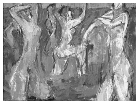
Werk von Bildhauer Siegfried Schreiber