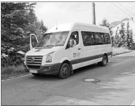
Mobiler Einkaufsdienst in Graupa

Viele, insbesondere ältere Bürger des Orts- teils Graupa klagten ihr Leid, dass vor Ort keine Kaufhalle vorhanden und so für die- jenigen, denen kein PKW zur Verfügung steht, das Einkaufen sehr schwierig ist. Trotz ständigen Bemühen der Stadtverwaltung wurde bisher kein Investor dafür gefunden. Gemeinsam mit dem ASB Königstein/Pirna e. V. ist es dem Ortschaftsrat Graupa, un- terstützt durch die FG Soziales der Stadt Pirna gelungen, einen mobilen Einkaufs- dienst zu organisieren, der 14-täglich für einen Unkostenbeitrag von 5 EUR Interes-