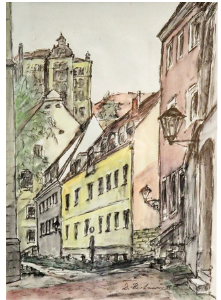
Altstadtgasse, Dieter Hartmann