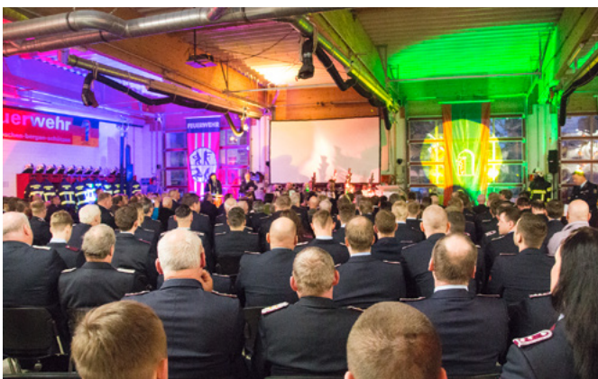
Die Hauptfeuerwache war prall gefüllt mit herausgeputzten Feuerwehrkameraden