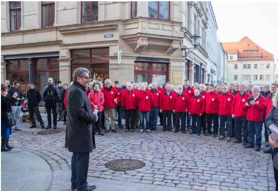
Mitglieder des Sächsischen Bergsteigerchors gestalten gemeinsam mit Musikern der Staatskapelle die Enthüllung der Tafel