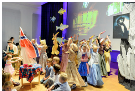
Aufführung „Der fliegende Holländer“

Zum zweiten Mal in diesem Jahr bringen die Richard-Wagner-Stätten Graupa die Wagner-Oper „Der fliegende Holländer“ in für Kinder umgearbeiteter Fassung auf die Bühne. Als zukünftiger Schirmherr der Veranstaltungsreihe „Wagner für Kinder“ wird der legendäre Wagner-Tenor René Kollo zu Gast im Jagdschloss Graupa sein.