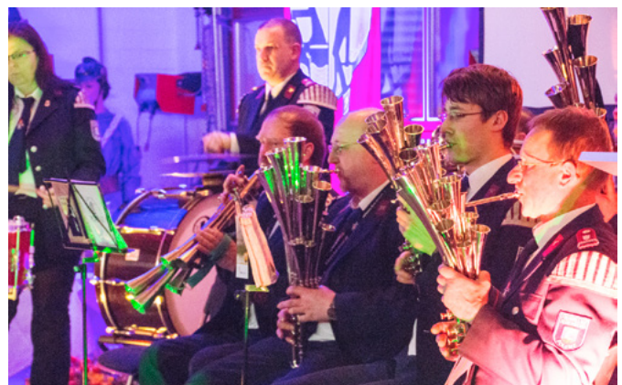
Das Feuerwehr-Schalmeienorchester Polenz sorgte für eine stimmungsvolle Umrahmung