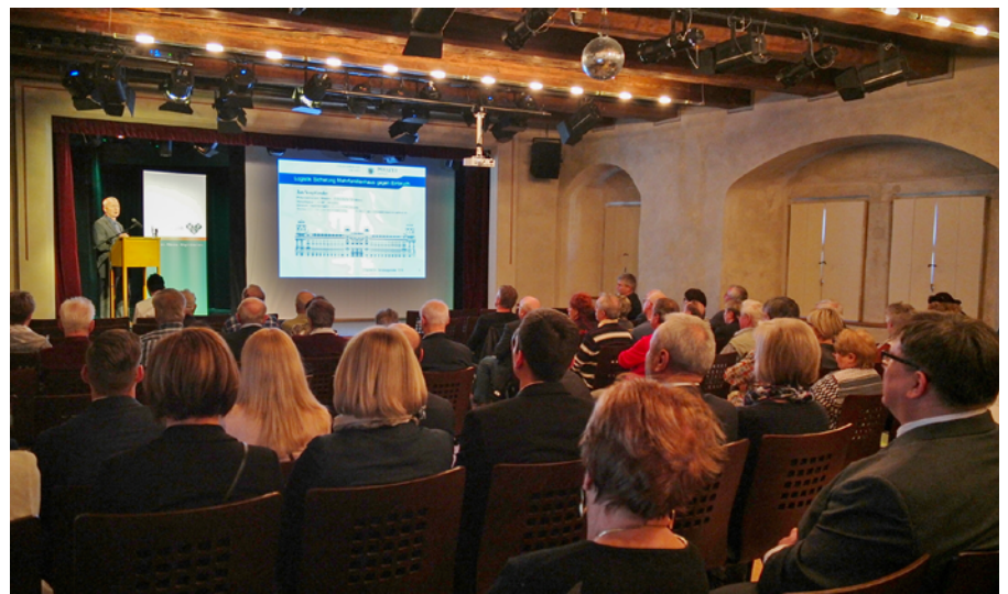
Fachvortrag zum 3. WGP-Verwaltertag im Tom-Pauls-Theater

werbeimmobilien vor Einbrüchen schützen lassen, welches Risiko im Zusammenhang mit Legionellen besteht, wenn Trinkwasseranlagen nicht ordnungsgemäß geprüft werden und vor welchen Herausforderungen Architekturbüros im Rahmen von Sanierungen von Wohngebäuden stehen. Abgerundet wurde die Veranstaltung durch einen Beitrag zu aktuellen Themen durch WGP-Geschäftsführer Jürgen Scheible. Neben ihren eigenen Objekten verwaltet die WGP derzeit rund 2.500 Einheiten, davon ca. 1.500 Wohnungen, für mehr als 100 andere Eigentümer in Pirna sowie in Städten und Gemeinden der Sächsischen Schweiz. (SSa)