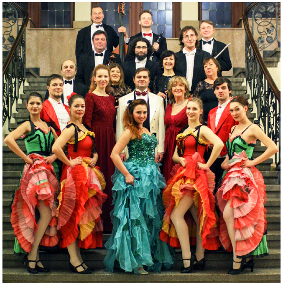
Ensemble der Operette

Das kulturelle Leben der Stadt und der Region wird im Frühjahr um eine Operettengala bereichert. Am 29. April 2017 findet ein Konzert mit dem Programm „Zauber der Operette“ in der Herderhalle statt. Das Ensemble gastiert schon zum 5. Mal in der Stadt, sicher erneut mit großem Erfolg. Die Operettengala wird von einem Moderator, drei Solisten, sechs Tänzern und zwölf Musikern dargeboten. Aus der Fülle der bekanntesten Operetten hat das Ensemble die schönsten Stücke ausgewählt und zu einem Ganzen gefügt. Einen Querschnitt aus der Vielzahl der Operetten und Werke der großen Komponisten präsentieren die Mitglieder des GALA Sinfonie Orchester's Prag. Zum Repertoire gehören u.a. Titel wie der „Kaiser Walzer“, „Wer uns getraut“, „Komm in die Gondel“, „Ich bin die Christel von der Post“, „Brüderlein und Schwesterlein“, „An der schönen blauen Donau“, der „CAN CAN“ und selbstverständlich der „Radetzky-Marsch“. Musik, Tanz und Gesang werden zu einem Bühnenerlebnis das Ohren und Augen anspricht. Einlass ist 15:00 Uhr, Beginn um 15:30 Uhr. Die Kartenpreise betragen 19, 24, 28 und 32 Euro. Für Gruppen ab zehn Personen sind auf Anfrage vergünstigte Preise möglich. Eintrittskarten gibt es u.a. im TouristService, Telefon 03501 556-445,