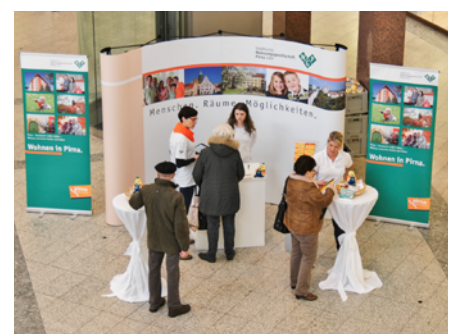
WGP-Infostand im Kaufpark Nickern

Ausflugsziel in der Freizeit, sondern auch als Wohnstandort beliebt ist. Die Große Kreisstadt Pirna ist nur wenige Kilometer von der östlichen Stadtgrenze von Dresden entfernt und bietet alle Vorzüge einer mittleren Stadt. Da in Pirna immer wieder Zuzüge aus Dresden zu verzeichnen sind, bewirbt die WGP seit einigen Jahren auch gezielt im Dresdner Osten den Pirnaer Wohnstandort. Ein im Rahmen dieser Promotion-Aktion imitiertes Gewinnspiel mit Preisen aus Pirna zeig-