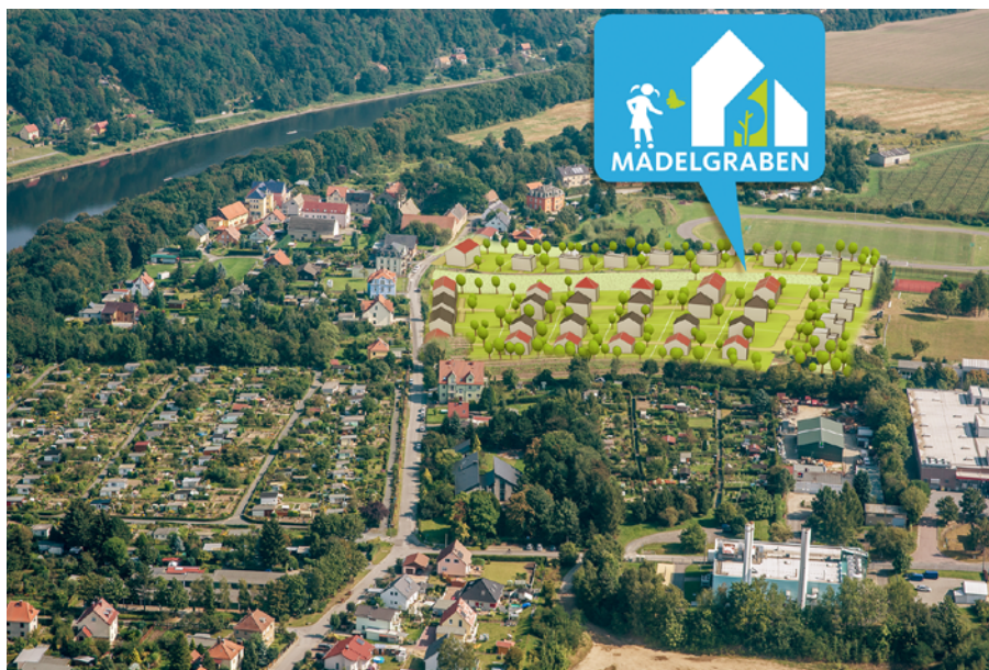
Wohngebiet Mädelgraben (Grafik: Stadtentwicklungsgesellschaft)

Für die Anwohner des Ortsteils Cunnersdorf sind während der Bauphase keine Einschränkungen zu erwarten. Lediglich für einen Zeitraum von etwa drei Wochen im Mai wird die Straße zur Verlegung der Telekomleitung halbseitig gesperrt werden, eine Ampel regelt dann den Verkehr. Auch außerhalb wird die Telekom Verlegungsmaßnahmen durchführen, über die gesondert informiert wird. Das Wohngebiet sowie der gesamte Ortsteil Cunnersdorf werden dann über eine hochmoderne Glasfaserverkabelung verfügen, die Internetgeschwindigkeiten bis 100 Mbit/s ermöglicht. Für die beiden neu entstehenden Anliegerstraßen wird noch ein Straßenname gesucht. Vorschläge sind gern willkommen. (KTe)