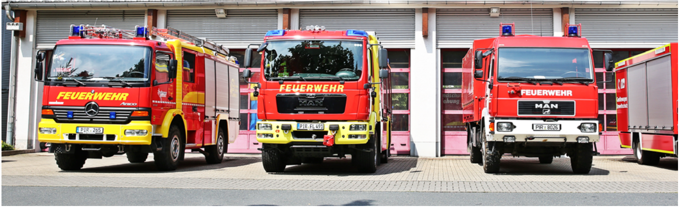
Hauptfeuerwache an der Clara-Zetkin-Straße