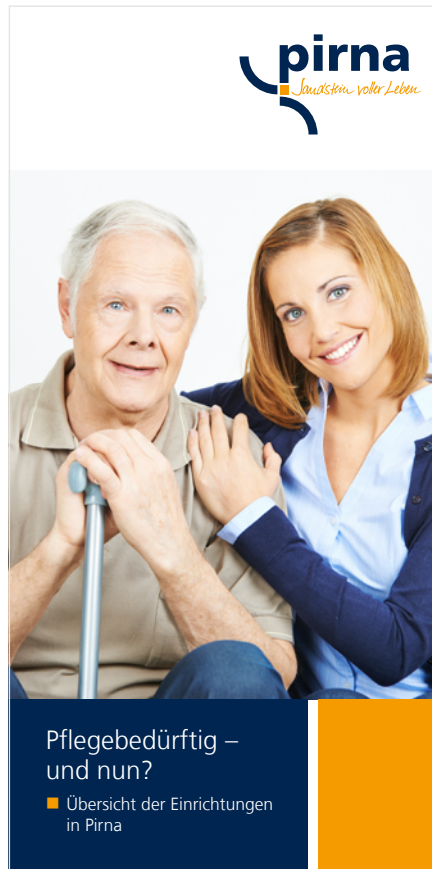
Titel Flyer

Ein neuer Informationsflyer gibt dazu einen Überblick über alle vorhandenen Pflege-Beratungsstellen und Pflege-Dienstleister in Pirna. Dieser ist ab sofort im Bürgerbüro des Rathauses, den Stadtteilzentren Sonnenstein und Copitz sowie bei Vereinen, die sich der Seniorenbetreuung widmen, erhältlich. Gleichzeitig kann man sich auf der Internetseite der Stadt Pirna