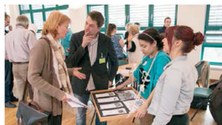
Marktplatz „Gute Geschäfte“ (Foto: Aktion Zivilcourage e. V.)

Ein Speed-Dating der besonderen Art für Unternehmen und gemeinnützige Organisationen verspricht der 3. Marktplatz „Gute Geschäfte“. Die Teilnehmerinnen und Teilnehmer haben rund zwei Stunden Zeit, um mögliche Kontaktpartner kennenzulernen und Kooperationsprojekte zu vereinbaren. In Frage kommen zum Beispiel ein Bewerbungstraining für Jugendliche,