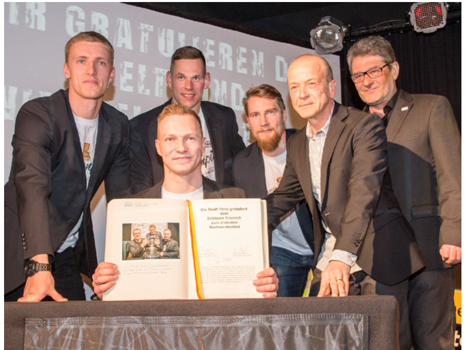
Die Mannschaft um Weltmeister Francesco Friedrich beim Empfang im vergangenen Jahr in der Kleinkunstbühne Q 24