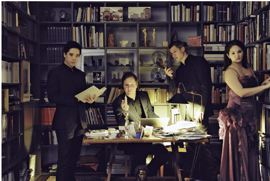
Klavierquartett CERES

STADTMUSEUM PIRNA ♦ RICHARDWAGNERSTÄTTEN GRAUPA ♦ HERDERHALLE PIRNA