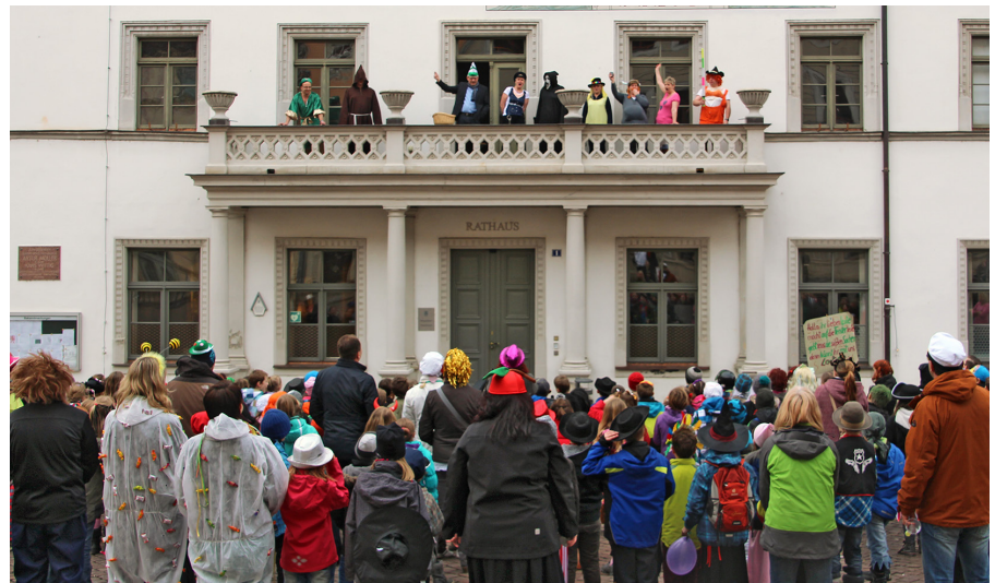
OB Hanke und Verwaltungsmitarbeiter begrüßen über 100 Kinder