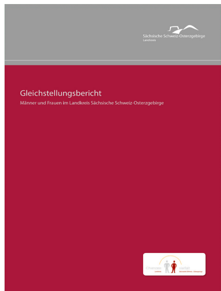
Gleichstellungsbericht (Broschüre: Landkreis Sächsische Schweiz-Osterzgebirge)