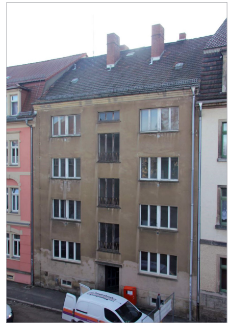
Der Anblick des Wohngebäudes an der Klosterstraße 6b gehört bald der Vergangenheit an: Voraussichtlich ab Herbst 2014 sind acht sanierte Wohnungen bezugsfertig

Das seit längerer Zeit leerstehende Gebäude wird nach energetischen Gesichtspunkten saniert. Eine moderne Gasheizung mit Brennwerttechnik und Solarunterstützung wird das Gebäude mit Heizung und Warmwasser versorgen. Die Sanierung wird voraussichtlich im Herbst 2014 abgeschlossen sein. Mietinteressenten für das Objekt können sich schon jetzt im WGP-