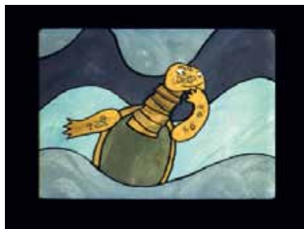
Aus dem Film von Maja Nagel „Die große Reise der alten Schildkröte“

Die Sonderausstellung ist vom 25.03.-31.08.2012 im Stadtmuseum Pirna zu sehen.