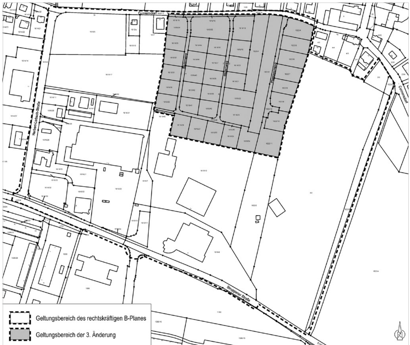
Entwurf des Bebauungsplanes Nr. 4.3 „3. Änderung des Bebauungsplanes Nr. 4 Mädelgraben“

Der nachfolgende Geltungsbereich verdeutlicht die Lage des Plangebietes. Die Änderung des Bebauungsplanes verfolgt als alleiniges Ziel die Umwandlung der privaten Straßenverkehrsflächen innerhalb des Wohngebietes in öffentliche Verkehrs-