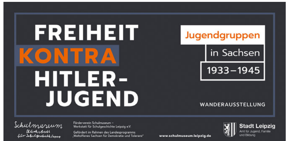
Postkarte zur Ausstellung

Noch bis zum 30. März 2018. zeigt das Alternative Kultur- und Bildungszentrum (AKuBiZ e.V.) eine neu entwickelte Wanderausstellung vom Schulmuseum Leipzig. Die Ausstellung befasst sich mit wenig bekannten oder völlig neu entdeckten Jugendgruppen, die zwischen 1933 und 1945 gegen die Nationalsozialisten in Sachsen aufbegehrten. Texte, Bilder und Dokumente machen deutlich, wie vielfältig die Formen von gruppenbezogener Nichtanpassung, Opposition und Widerstand zwischen 1933 und 1945 waren. Die Ausstellung versucht zu zeigen, dass Widerstand keine Sache übernatürlicher Helden ist, sondern auch im Kleinen, in der Nachbarschaft, an Orten, an denen man es bislang nicht vermutete, stattgefunden hat. Zur rechtsextremen Ideologie unserer Tage gehört u. a. die Glorifizierung