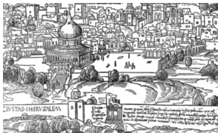
Erhard Reuwich, Ansicht von Jerusalem, 1486

Immer wieder brachen Wettiner im spä-ten 15. Jahrhundert ins Heilige Land auf. Die aufwändige, mehrere Monate dau-ernde Pilgerfahrt war zugleich Abenteuer-erreise und Bewährungsprobe, vor allem aber die Begegnung mit einer dem christlichen Europa so fremden Welt. Der Vortrag von Dr. André Thieme blickt auf Hintergründe und Folgen der wet-tinischen Pilgerreisen und bringt ein oft vergessenes Kapitel mittelalterlicher Ge-schichte zurück.