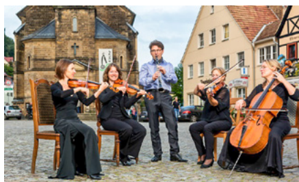
Streichquartett und Soloklarinetist

Die Musikerinnen und Musiker spielen zu Beginn die Don-Quixote-Suite von Tele-mann über die Abenteuer des gleichnamigen Ritters, darunter auch der berühmte Kampf gegen die Windmühlen. Aus den Fünf Novelletten op. 15 des Russen Alexan-der Glasunow wird der Walzer gespielt. Als