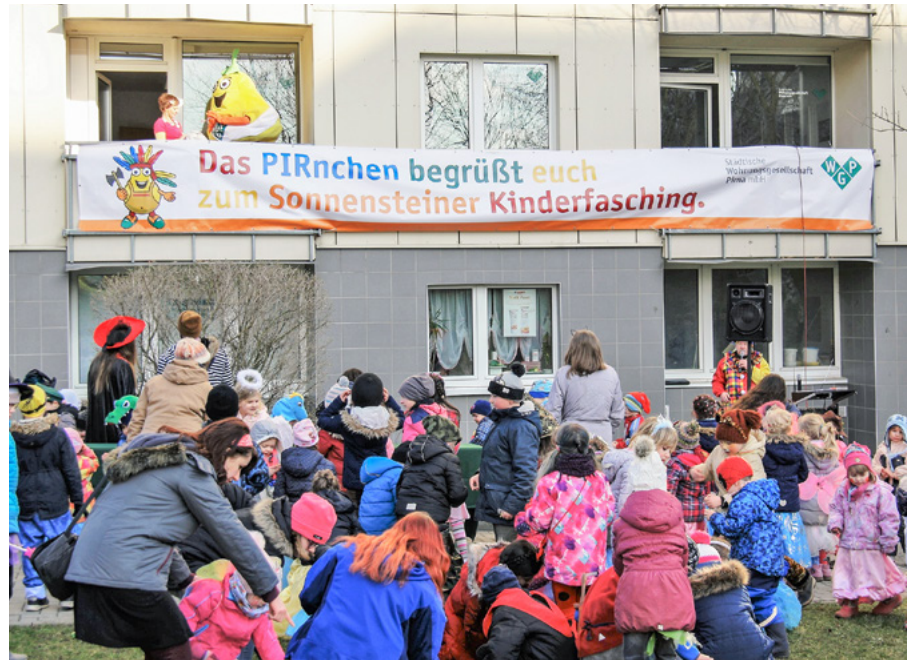
Pirnchen, das Maskottchen der WGP, lässt über die zahlreiche Narrenschar Bonbons regnen