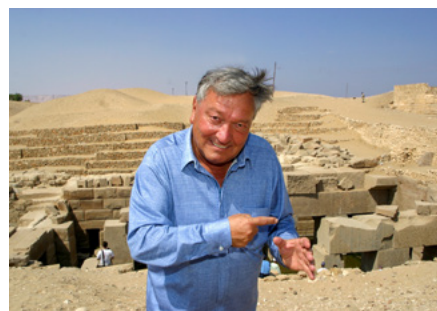
Erich von Däniken

Aus dem Fundus seines einzigartigen Archivs holt Däniken zum globalen Rundumschlag aus. Die uralte Grabplatte von Palenque in Mexiko? Von Fachleuten falsch gedeutet! Die Ebene von Nazca in Peru mit ihren kilometerlangen Linien und Scharrzeichnungen im Wüstensand? Von der Archäologie zu kurz interpretiert – argumentiert der Erfolgsautor und erschlägt seine Zuschauer mit einer atemberaubenden Bilderkaskade. Denn ebenso großflächige