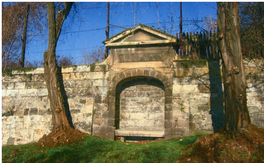
Ruhebank am Hausberg