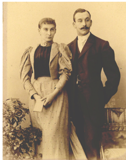
Angebot Archivkurs

Angelika Reiß, Musikschule Sächsische Schweiz e.V.