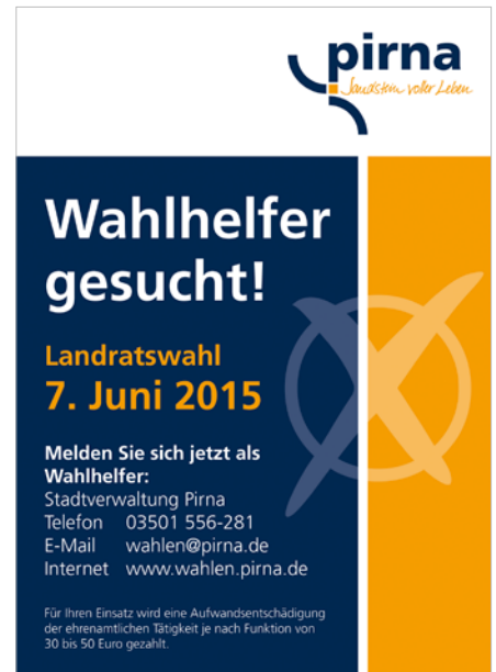
Plakat Wahlhelfer

In der Satzung der Stadt Pirna vom 12.07.2005 ist der durch die Gemeindeordnung des Freistaates Sachsen festgelegte Anspruch auf Entschädigung der ehrenamtlichen Tätigkeit von Wahlhelfern geregelt. So bekommen Helfer je nach eingesetzter Tätigkeit 30 bis 50 Euro für Ihren Einsatz. Voraussetzung für die Unterstützung ist die Wahlberechtigung nach §§ 15 und 16 der Sächsischen Gemeindeordnung. Bewerber oder Vertrauenspersonen