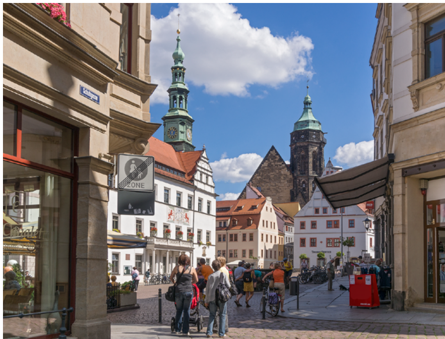
Blick auf den Obermarkt

Am 12. Februar kam die kürzlich ins Leben gerufene „Lenkungsgruppe Marktplatz“ zu einem ersten Arbeitstreffen zusammen. Während der konstituierenden Auftakt-sitzung wurden alle vier eingegangenen Bewerbungen auf die vormals zwei ausgeschriebenen Plätze für ortsansässige Bürger mehrheitlich von der Lenkungsgruppe bestätigt und damit die Zahl der Bürger aufgestockt. Des Weiteren legten die Mitglieder fest, dass auch die Belange von Jugendlichen mit zwei Sitzen vertreten sein müssen. Die Stadtverwaltung kontaktiert daher gegenwärtig die Schülervertretungen der weiterführenden Schulen Pirnas. Für die Moderation und die Begleitung des Prozesses soll auf Wunsch des Gremiums die zukünftige Fachgruppenleiterin Bau der Stadtverwaltung einbezogen werden. Ein weiteres Ergebnis der ersten Sitzung war die Entscheidung, für die kommende Sitzung am 12. März 2015 zwei ortsansässige Planungsbüros als externe Fachberater einzubeziehen. Ferner wird ab dem nächsten Zusammentreffen das Landes-