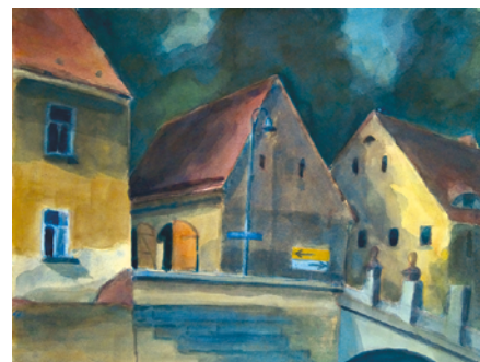
Haus