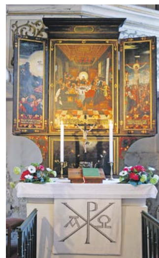
Schloßkirche Zuschendorf

Dippoldiswalder Straße 23 Telefon: 0351 2018 390 info@nak-mitteldeutschland.de www.nak-mitteldeutschland.de ■ mittwochs – 19:30 Uhr Gottesdienst ■ sonntags – 9:30 Uhr Gottesdienst