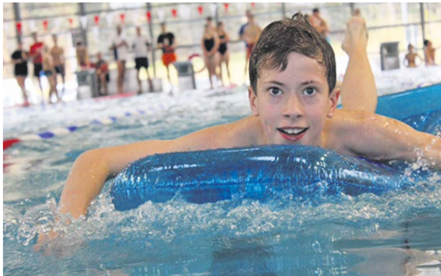
Auch der Spaß kam beim Wettbewerb der Ruderer nicht zu kurz

Dafür zeigten die Pirnaer Starter in den vorherigen 38 Entscheidungen ihr gutes Schwimmvermögen. Dieses ist gleichzeitig ein guter Garant für die Sicherheit, wenn es in der Rudersaison mal zu einer feuchten Begegnung kommen sollte. Das zusätzliche Schwimmtraining aus den letzten Wochen zahlte sich aus. 8 Einzelsiege, 3 × Platz 2 und 7 × Platz 3, waren sehr respektabel. Dazu addieren sich drei Erfolge in den Staffeln.