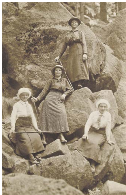
Erkunden Sie Ihre Familiengeschichte!