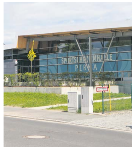
Die Sportschwimmhalle auf der Seminarstraße in Pirna