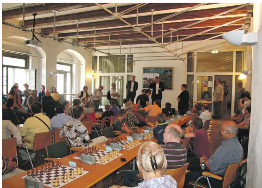
Interkulturelles Schachturnier im Großen Ratssaal

Organisiert wurde das Schachturnier vom „Ran ans Brett e.V.“, der AWO Sonnenstein gGmbH (Migrantenberatung für Erwachsene) und der Stadt Pirna. (TGo)