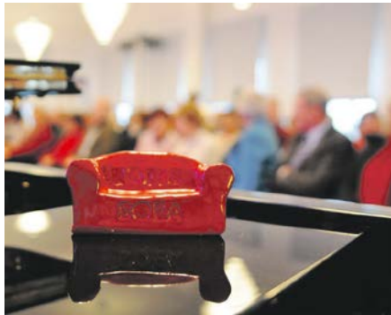
Rotes Sofa