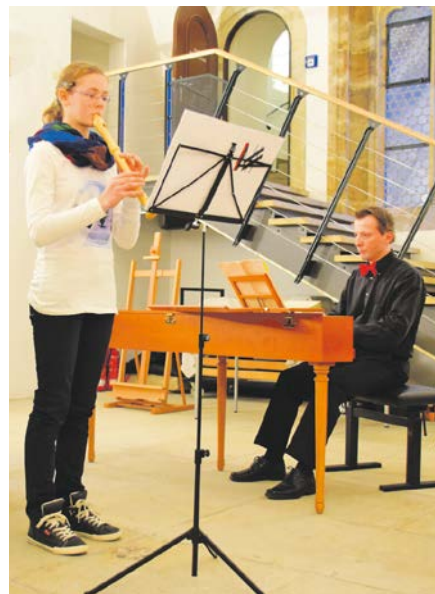
„Jugend musiziert“

Am Samstag, dem 5. März, zeigen ab 17 Uhr die jüngsten Künstler des Kreises im Stadtmuseum Pirna ihr Können.