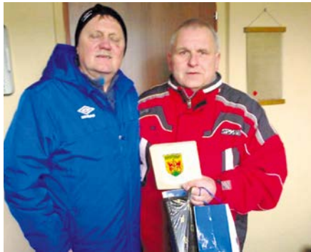
Die sportlichen Leiter des FK JUNIOR Děčín (links) und des 1. FC Pirna (rechts) überreichen sich Gastgeschenke

Sportlich intensiv gelebte Städtepartnerschaft über die 90ste Spielminute hinaus