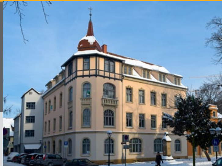
Unser Geschäftssitz in der Gerichtsstraße (1. OG)