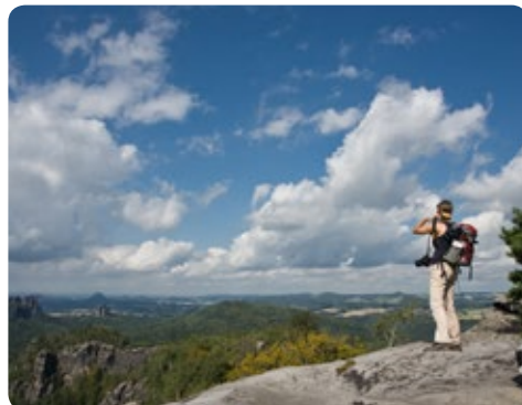
Die kurzen Entfernungen zur Landeshauptstadt Dresden und zur Sächsischen Schweiz machen Pirna zu einem attraktiven Wohnstandort.

Stadt | Entwicklungsgesellschaft Pirna mbH