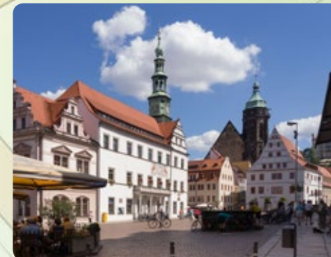
Historischer Marktplatz in Pirna