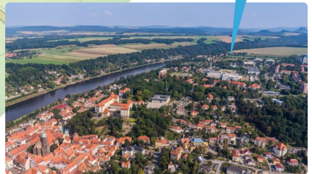
Das Baugebiet oberhalb der Elbe, des Stadtzentrums und vor der Kulisse der Sächsischen Schweiz