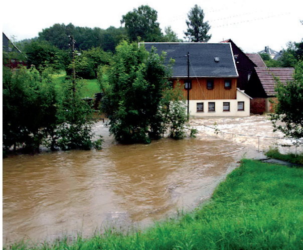
Unterschätzte Gefahr Starkregen: Überschwemmungen betreffen längst nicht mehr nur Hochwassergebiete. Ein Beispiel ist Bertsdorf-Hörnitz bei Görlitz: Dort fielen 101 Liter/m² Regen (entspricht ca. 10 Eimer Wasser) allein am 7. August 2010 (normal sind 78 Liter/m² im ganzen Monat). Ereignisse wie dieses machen die Hälfte aller Überschwemmungen aus.

Und das, obwohl etwa 98,5 Prozent der Gebäude in Deutschland bereits mit Standardprodukten versichert werden können.